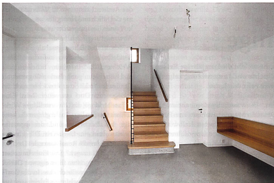
Le hall d'entrée de la mairie. L'escalier a été refait en béton en maintenant les dimensions d'origine.

Die Treppe im Eingangsbereich des Gemeindehauses wurde neu in Beton ausgeführt. Die Originalabmessungen wurden beibehalten.