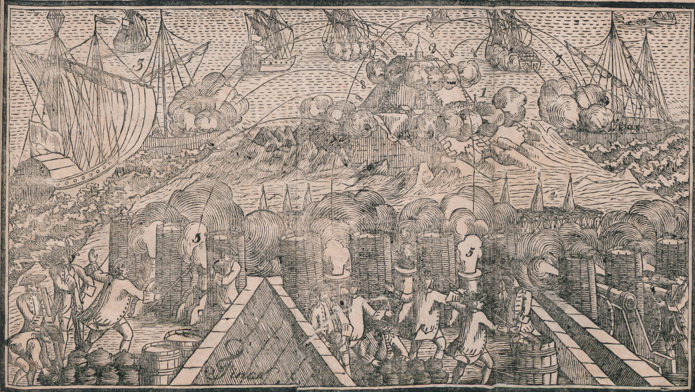
Belagerung der Festung und Citadel Belle-Isle, durch die Englische Escadre unterm Admiral Keppel, im May und Brachmonat des 1761. Jahres.