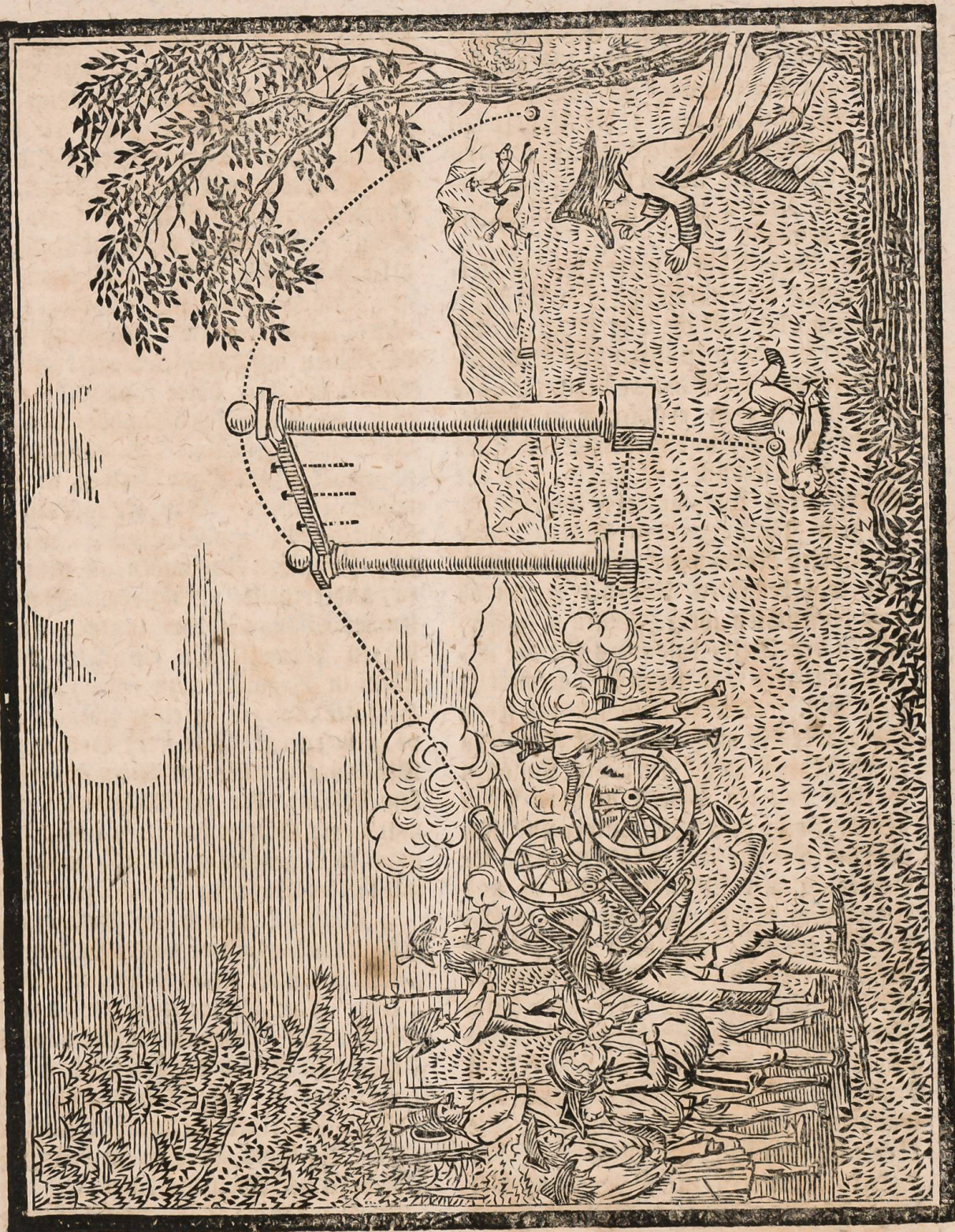
Vorstellung eines Galien-Bombardements im Jahr 1798.