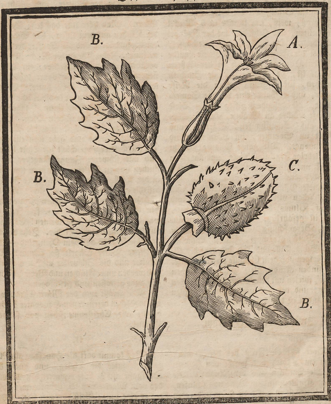
A. Die Blume. B. Die Blätter. C. Die Frucht, oder die Hülse worin die giftigen Samenkörner liegen.