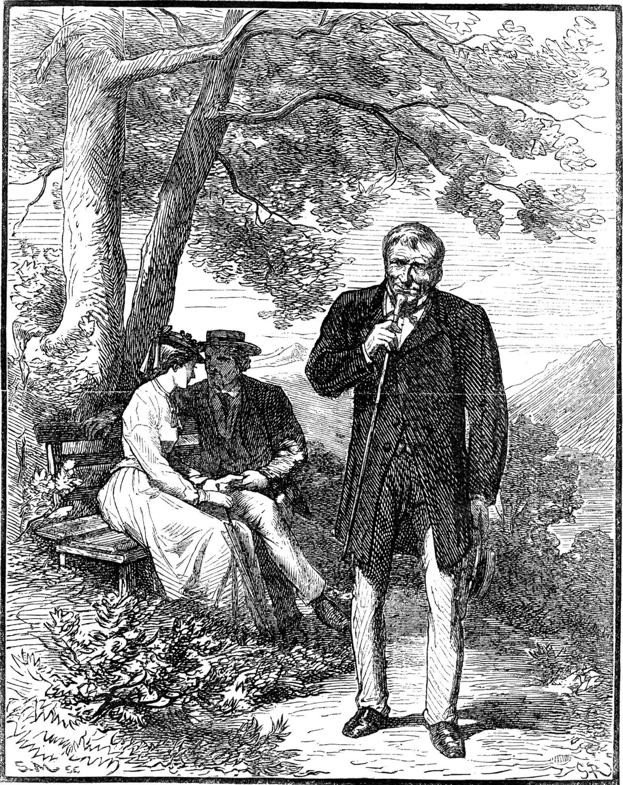
Der Better aus Australien.