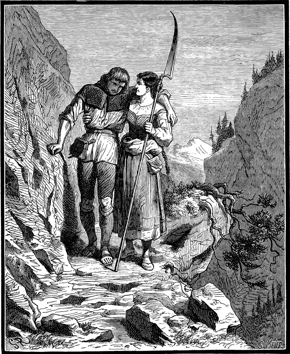
Die Weiberschlacht auf der Dangermatte.