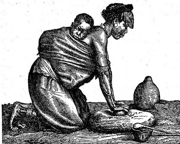
Kaffernweib, Mais mahlend.

29. August 1848 erlitten sie bei Boomplatz eine Niederlage, in Folge deren Pretorius sich mit dem größten Theil der Bauern auf das nördliche, rechte Ufer des Baalflusses begab, wo von ihnen die Transvaal-Republik gegründet wurde. Im Jahre 1852 gab das englische Colonialdepartement der Orange-River-Sovereignty ihre frühere politische Selbstständigkeit als republikanisches Staatswesen zurück und erkannte zugleich auch die politische Unabhängigkeit und Selbstständigkeit der sogenannten, zuletzt von J. W. A. Pretorius gegründeten Transvaal-Republik an.