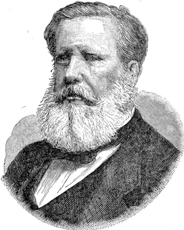
Kaiser von Brasilien.

Gram über den Verlust des Thrones. — Mit jener unblutigen Revolution ist die letzte Monarchie in der neuen Welt zu Grabe getragen. Neue Monarchien gibt's überhaupt in der Welt kaum mehr, wohl aber neue Republiken. Das ist der Windzug der neuen Zeit, der in vielen Residenzen unangenehm verspürt wird.