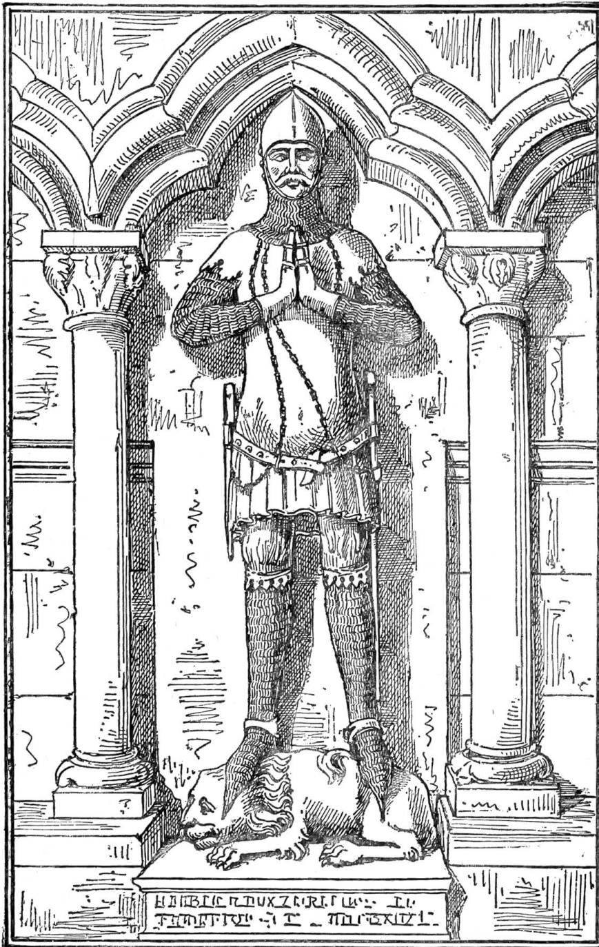
Im Münster von Freiburg i. Breisgau.

fin burg lag, daz were die beste hoffstat von werlichkeit (Wehrhaftigkeit), dieselbe hoffstat die are beslüsse mit ir umgang; es stund ouch des-selben males uf der hoffstat ein eichwald. Aldo gedachte der here der sach nach; am lesten beschowete