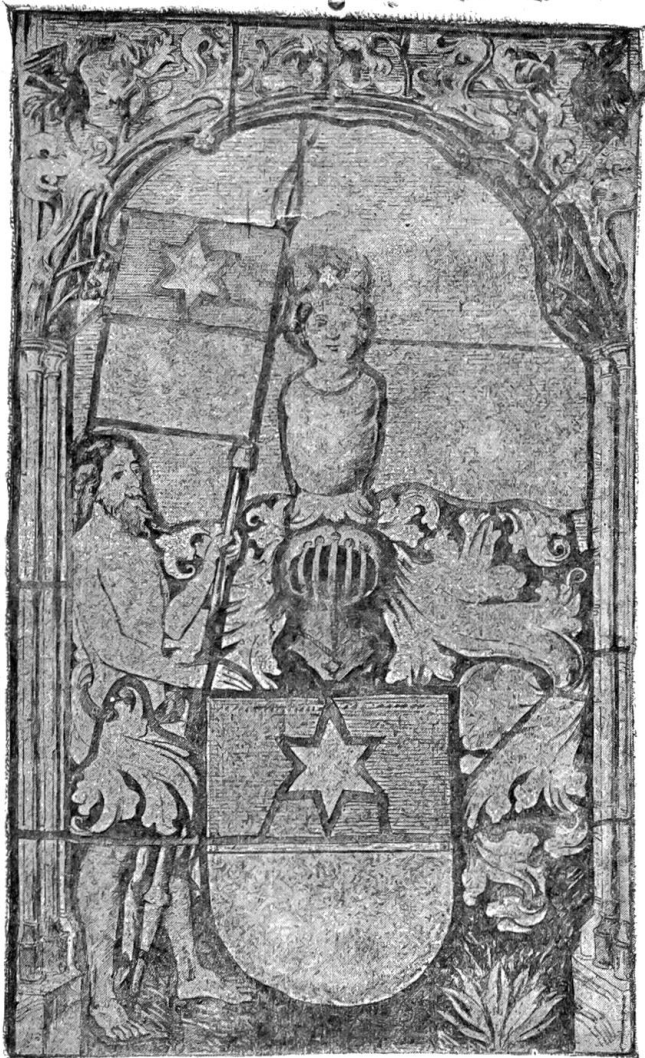
Wappen der Bubenbergs.

Auch das Aussehen der Stadt kann man sich im 13. Jahrhundert kaum bescheiden genug denken. Wenn einer jener ersten „Bürger“ heute wiederkäme und unsere mächtigen Sandsteinbauten erblickte, er würde seine Wohnstätte nicht wiedererkennen. Dorfartig, durch Gärten, Scheuern, Stallungen unterbrochen, waren die hölzernen Häuser aneinander gereiht. Die Dächer zeigten zwar gewiß von Anfang an die burgundische, die Front des Hauses wagrecht abschließende Form im Unterschied von den schwäbischen Giebelhäusern, wie sie in Schaffhausen, Zürich und Zug die Regel bildeten. Auch die Lauben waren schon in den Anfängen vorhanden. Aber die Bedachung bestand nur aus Stroh oder Schindeln, letztere wohl auch noch mit sogenannten „zentrigen Dachnägeln“, d. h. Steinen, beschwert, wie