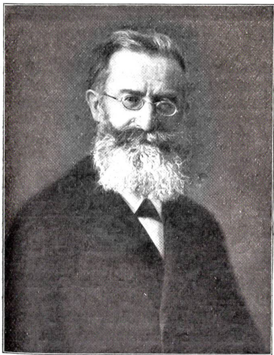
Dekan Furrer. † 14. April 1908.

Juni. In London erringt der Nationalturner Zemm aus Davos durch seinen glänzenden Sieg über einen französischen Ringer die 2. Weltmeisterschaft. — 4. Herr Bundesrat Zemp überreicht der Bundesversammlung seine Demission. — 7. Zum Andenken an Obergerichtspräsident Tschudy-Mebli vergab dessen Familie Fr. 50,000 zu wohltätigen Zwecken. — 17. Herr Nationalrat Schobinger in Luzern wird als Nachfolger von Zemp in den Bundesrat gewählt. — 29./30. Der Ballon „Cognac“ des schweiz. Aeroclubs mit 4 Passagieren, unter ihnen Kapitän Beauclair, macht vom Eigergletscher aus eine wunderbare Fahrt über das Jungfrau- und Simplonmassiv und landet in Stresa.