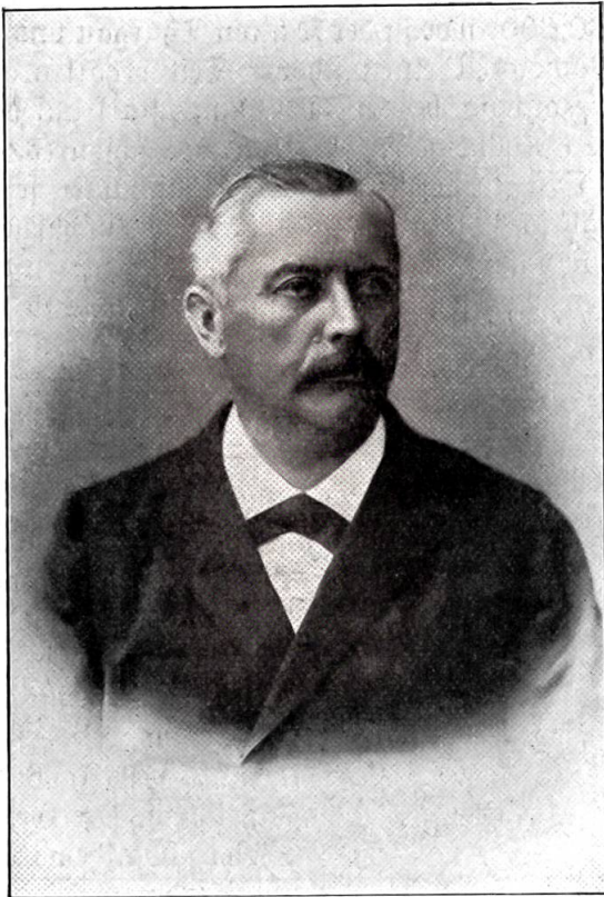
Regierungsrat Minder. † 15. Oktober 1907.

das neue Knabensekundarschulhaus auf dem Spitalacker festlich eingeweiht. — 24. Das Luftschiff des Grafen Zeppelin unternimmt von Manzell aus eine gelungene Fahrt über den ganzen Bodensee. — 29. Die Kirchgemeindeversammlung an der Nydeck zu Bern wählt Hrn. Pfr. Benjamin Rickli in Meiringen als Nachfolger des Hrn. Pfr. Aeschbacher. Über die Gegend zwischen Suberg und Großaffoltern geht abends ein fürchterliches Hagelwetter nieder und verwandelt sie in eine richtige Winterlandschaft. Am Schwingerturnier in Zürich erhalten die Emmentaler G. Wittwer und H. Bärtschi die ersten Kränze.