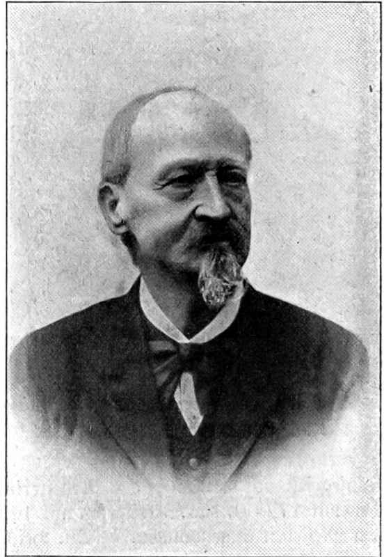
Prof. Dr. Bogt. † 28. Dezember 1907.

Februar 7. Ein ehemaliger Student der Medizin an der Universität Zürich übermittelt der Erziehungsdirektion des Kantons den Betrag der ihm seinerzeit verabsolgt Stipendien und außerdem eine