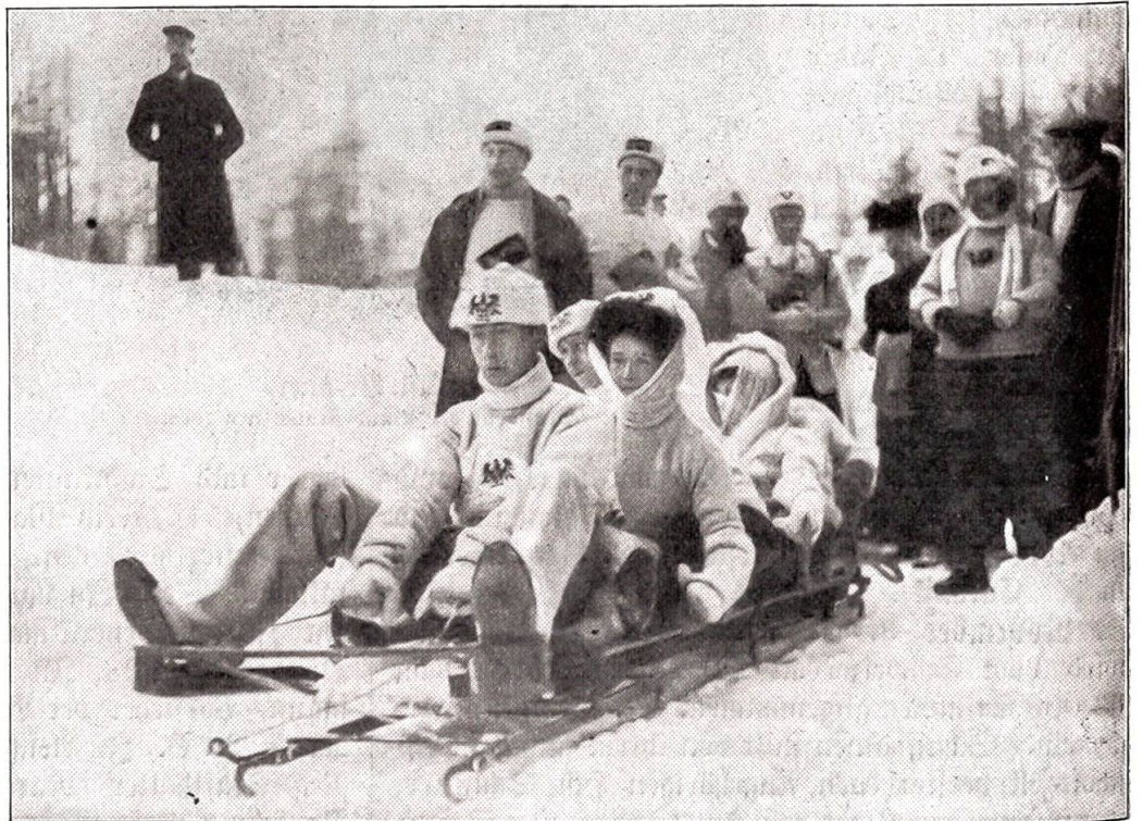
Der Wintersport in St. Moritz.