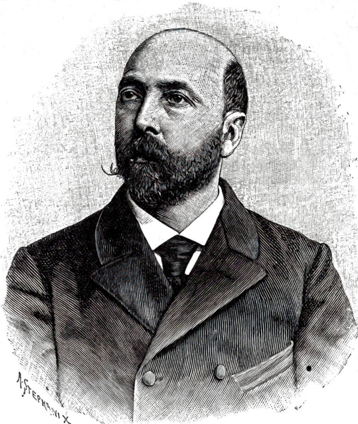
Ernst Brenner, Präsident des Bundesrates pro 1908.

Fr. 2,360,000, wovon der Kanton Thurgau und die Stadt Bischofszell einen schönen Teil erhalten. — 11. Die Zofingia begeht 761 Mann stark auf dem Rütli die 600jährige Feier des Bundeschwures. — 16. Die Offiziersgesellschaft von Schaffhausen feiert ihr 100jähriges Jubiläum. — 25. Hr. Buchdrucker Ziebig in Chur hat auf der diesjährigen internationalen Ausstellung für graphische Künste in Paris die goldene Medaille erhalten.