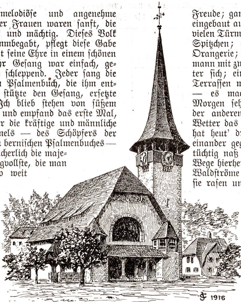
Neue Kirche in Spiez.

Und nun sei noch mit den Notizen eines Bekannten unsere Schilderung von Spiez beschlossen. Am 8. Aug. 1831 schrieb Felix Mendelssohn-Bartholdy seiner Schwester Fanny Hensel: „Abends. In Spiez wurden wir nicht angenommen; es ist da kein Wirtshaus zum Übernachten. Ich mußte also hierher — nach Spiezwiler — zurück. An der Lage von Spiez hatte ich meine