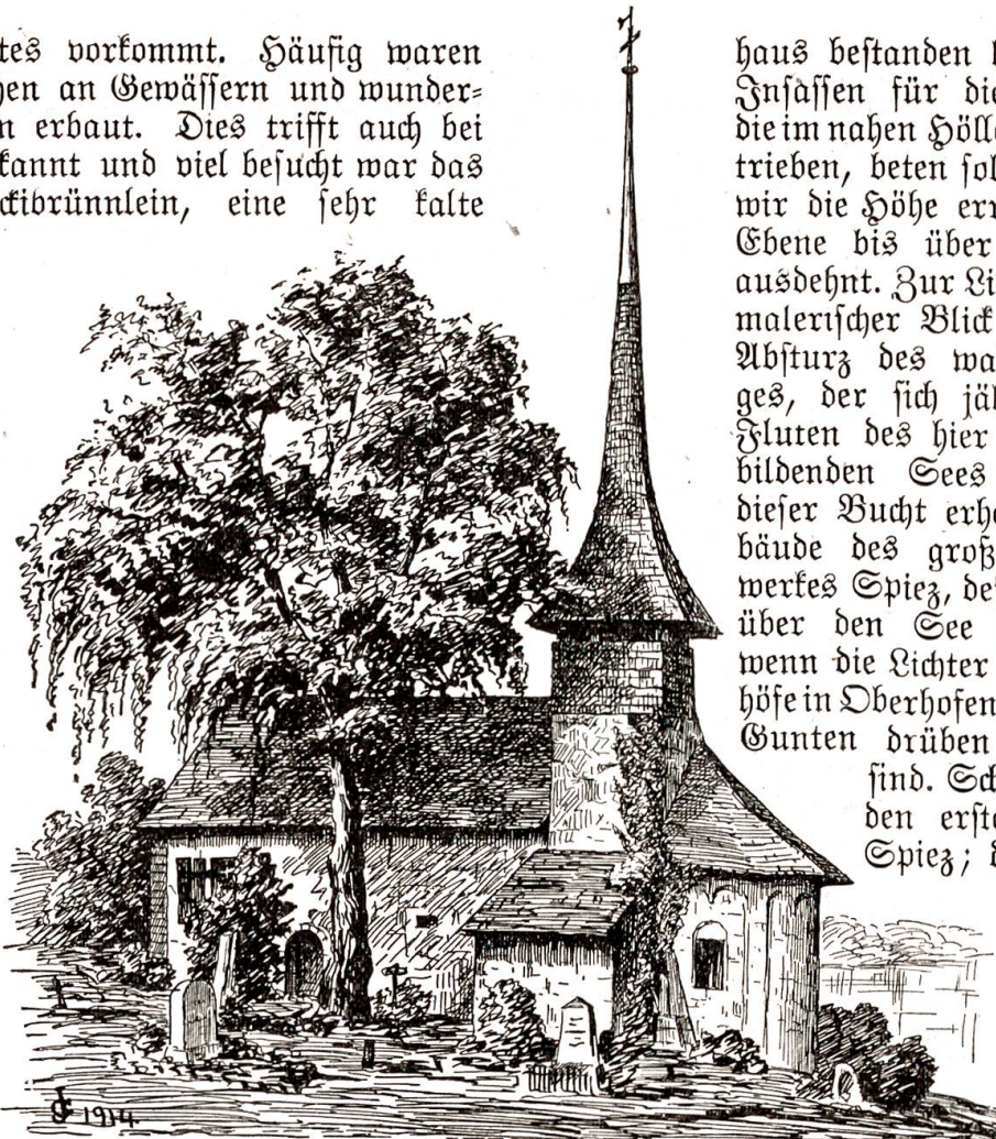
Kirchlein in Einigen.

deutschen Gebietes vorkommt. Häufig waren die Michaelskirchen an Gewässern und wunderthätigen Brunnen erbaut. Dies trifft auch bei Einigen zu. Bekannt und viel besucht war das sogenannte Fuchbrünnlein, eine sehr kalte Quelle, in der die Leute in den Kleidern badeten, die aber mit vielen andern nach dem Kan- derdurchstich von 1714 versiegte. Der Kirchenjatz ging 1338 von den Strätlingen an die Buben- berg über und gehörte von da an den jeweiligen Besitzern der Herrschaft Spiez. Laut dem Visi- tationsbericht von 1453 befand sich das Kirchlein in ärmlichem Zustande. Die Gemeinde gehörte zu den kleinsten der Land-