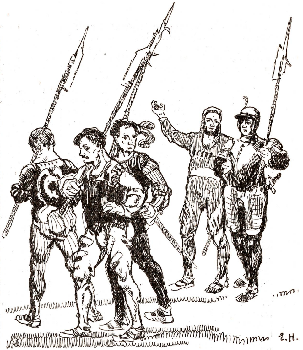
In ihren Reihen befand sich Erni.

Einige Monate später kam in Frankreich Franz der Erste zu Thron und Krone und legte sich herausfordernd gleich den Titel eines Herzogs von Mailand bei. Das bedeutete Krieg. Die Lombardei mochte dürsten, sie sollte getränkt werden. Der junge König machte gewaltige Rüstungen und zog dann über die Alpen, um sich Ritterehren und nebenbei auch sein Herzogtum auf dem Schlachtfelde zu verdienen. Die Schweizer, von den Mailändern herbeigerufen, rückten ihm über den Gotthard entgegen. In