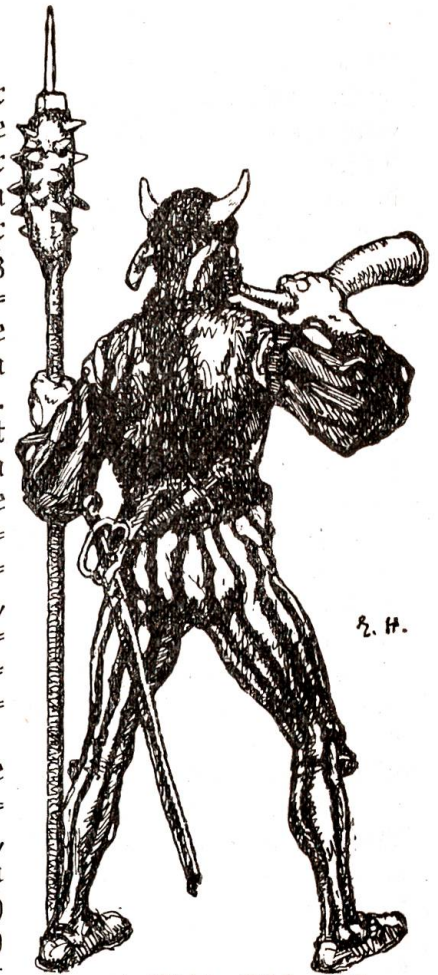
Man unterschied deutlich den „Stier von Uri“, der an diesem Tag zum letztenmal brüllen sollte.

Eben hatte er einen Landsknecht niedergestossen und die Hellebarde mit einem starken Ruck