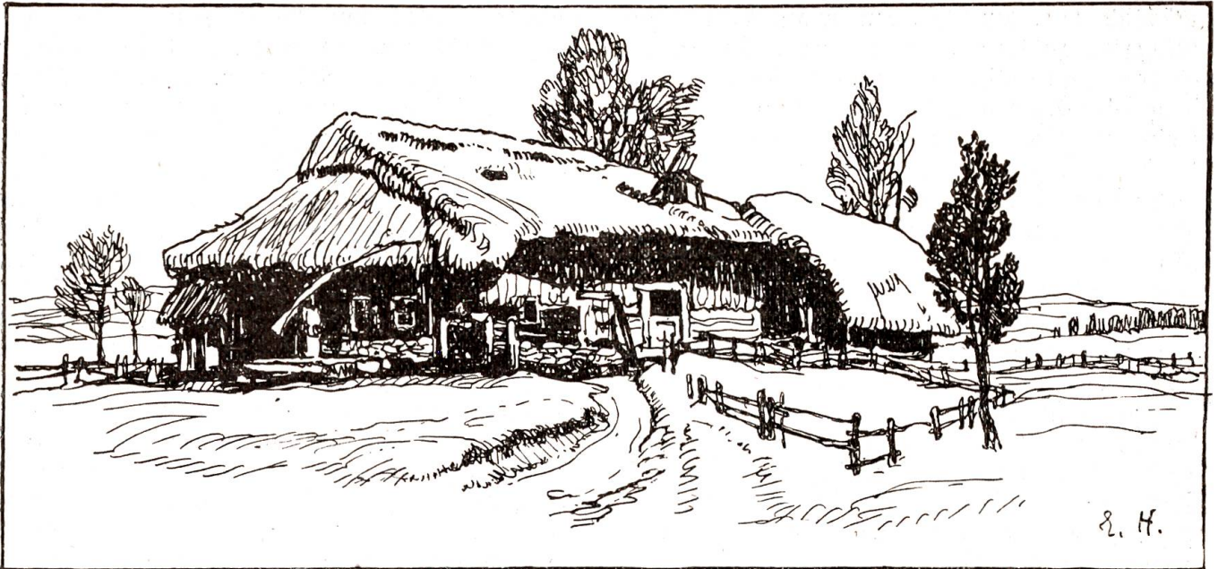
Sie bewirtschaftete ein kleines Gut, das die „Breite“ hieß.