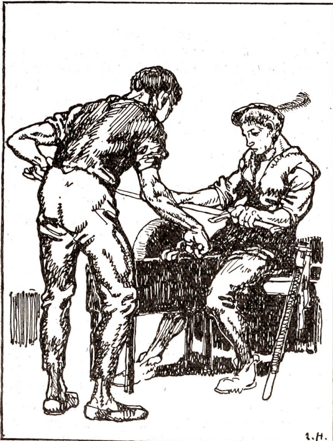
Er musterte jeden zweiten Tag seine Waffen und erzog sich den Bruder nach seinem Geschmack.

Erni vergötterte den „Großen“, der ihm in allem unvergleichlich schien. Die Liebe, die die Natur in ihm für den Vater gepflanzt hatte, hingte er blindlings an Jörg und hatte keinen andern Gedanken, als ihm in allen Dingen gleich zu werden. Jörg ließ es sich gefallen und vergalt Ernis Bewunderung mit einer leicht verhüllten, rauhen und bärenhaften, aber aufrichtigen Zuneigung. Es tat ihm wohl, von jemand mit treuherzigen Augen angestaunt zu werden, jemand zu haben, der sich ihm mit ganzer Seele ergab, dessen einziges Streben war, seine Art zu reden, seine Art zu lachen und sich zu tragen anzunehmen, und dem er dafür Be-