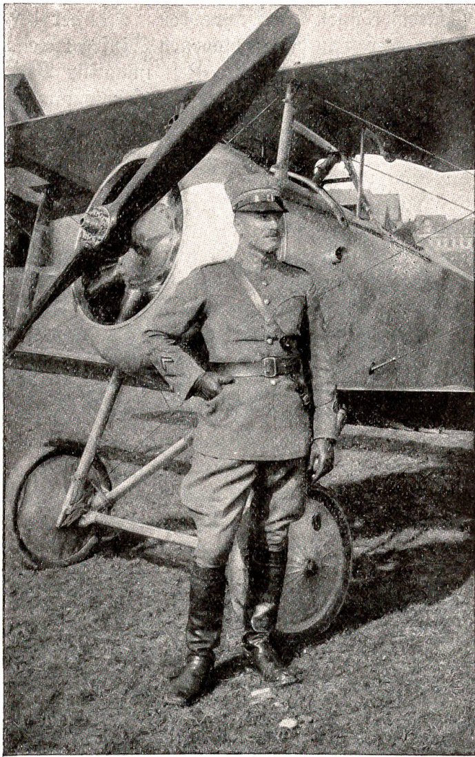
Oskar Bider (1891—1919).

Diese Zeilen waren bereits geschrieben, als die Trauerkunde vom Tode des Oberleutnants Oskar Bider eintraf. Er verunglückte am 7. Juli 1919 in Dübendorf bei der Ausführung eines Sturzfluges. Bider war in der ganzen Schweiz bekannt und berühmt. Als Erster überflog er im Jahre 1913 die Alpen, und seither führte er eine lange Reihe von kühnen Unternehmungen durch. Der schweizerischen Aviatik hat er große Dienste geleistet durch die Heranbildung von Militärfliegern. Er wird in der Geschichte der Aviatik in der Schweiz stets mit hohen Ehren erwähnt werden.