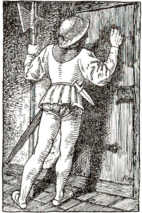
An der Frau Ann ihre Thür schrieb ich: Leb wohl Rosine.

Und da ich wieder zum Thor kam, wußt ich nit wie ich hinaus kommen sollt und trat zu dem Hauptmann und fragt ihn obs nit gut wär daß etlich Gfellen hinaus giengen, um zu erfahren, was für Volk vorbey zogen und wo es hin sey. Das gfiel ihm fast wohl und fragt: willst du gahn? und als ichs bejaht, sagt er, daß ich etlich jung Gfellen mit mir nehmen sollt; aber da hatt niemand Lust den ich darum ansprach, und meintend das wär ein unnöthig Werk, man werds sonst hören. Da wär ich gern allein ggangen, aber der Hauptmann befahl etlichen Knechten, daß sie mit mir mußten, gab uns auch ein Kry (Feldgeschrey) damit man uns erkennen möcht, wenn wir wieder zurück kämen. Und waren wir nit halb bis zum Brügglein, als die Gfellen meinten man sollt wieder zurück, und habe gnug gesehen daß nichts Verdächtigs vorhanden sey: aber ich gieng stets fürwärts, und da wir gegen den Hag kamen, wo die Weidstöck stehn, glaubten sie es wären Kriegsleut und wollt ihr keiner mehr weiters; da gieng ich allein und hört bald darauf wie sie mir rufen, kehrt mich aber nit daran, und luff fürbas St. Margrethen zu.