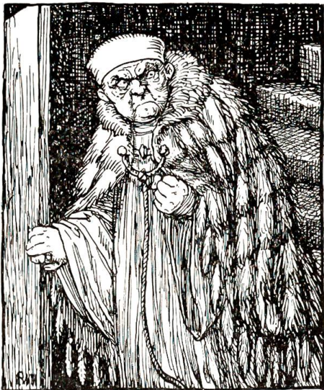
Da merkt der Thumherr wohl, daß sie drinnen war, und fieng wieder an zu klopfen.

Rosine! Rosine! Aber sie schmuckt sich an die Wand und hielt ihre Hand für's Maul, und nach einer Weil, da er merkt daß man ihm nit aufstun wollt, brummet er etwas, das ich nit verstand, hört ihn auch die Stege auftrampen und des Vaters Thüre aufschrenzen, da schämt ich mich daß ich die Rosine im Verdacht gehabt hatt und kroch auf allen Vieren wieder ins Haus und in meinen Gaden, wußt auch nit sollt ich hinauf gehn oder drunten bleiben, denn ich hört wie er gar laut mit dem Vater redt und der Vater auch mit ihm, und eh ich wußt' was ich thun sollt, kam er schon wieder die Steg ab und eilt zum Haus aus.