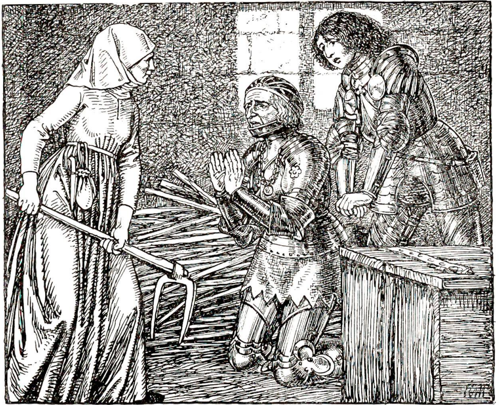
Da haben die Herren sie um Christi Leiden und martervollen Todes willen gebeten sie sollt sie nit verrathen.

Harnisch nit verkauft, denn sie dieselben lösen und mehr dafür geben wollten als kein anderer gab. Und da es dunkel und man die Thor schloß führt ich sie fort, und waren gar in großer Angst als sie am Bruderholz die Feur der Schweizer sehend, die da besammelt waren und vorhatten morndes ins Suntgau zu ziehen. Aber ich bracht sie glücklich weiters und gab ihnen wohl bey 2 Meilen weit das Gleit, denn sie nie glauben wollten daß sie in Sicherheit wären; und als ich von ihnen schied dankten sie mir über die Maßen, versprachen auch daß sie mir und den Meinen den Dienst zeitlebens nit vergessen wollten, und kann ich in Wahrheit sagen, daß sie redlich Wort hieltend,