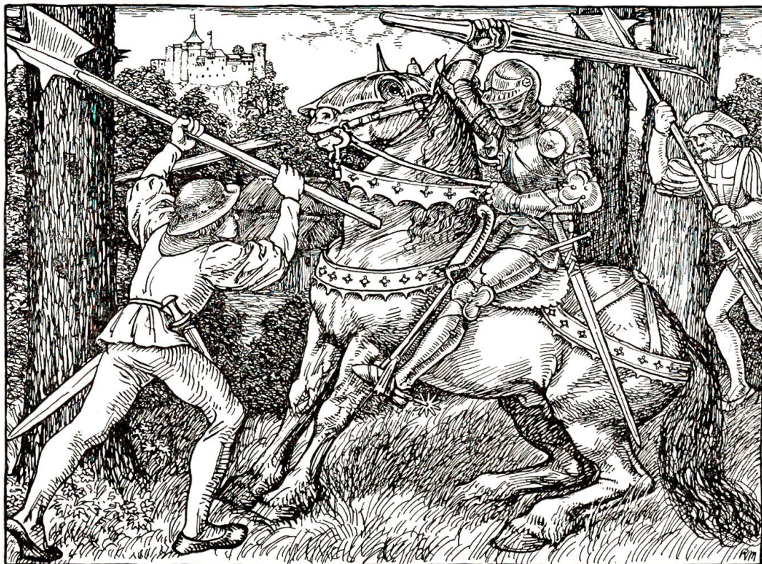
Ich schlug mit meiner Halparten auf ihn zu, daß er für sich dem Roß auf den Hals fiel.

Und da wir giengen erzählst sie mir, als mein Vater am Morgen erwacht sey, hab er meine Schrift auf dem Tisch funden und sey da voll Schreckens herunter kommen und hab da auch die Schrift an ihrer Thür glesen und anfangen laut zu jammern und ihr zu rufen, und wären sie auch zum heftigsten über die Wort erschrocken und sey die Rosine eilends zum Thor glossen um zu sehen ob ich noch dort wär, hab aber da den Bricht ghört, daß ich in der Nacht zum Thor aus und nit mehr zurückkommen sey, so daß man glauben müß ich sey gefangen und vielleicht gar tod. Da sey die Rosine in Ohnmacht gefallen und habe man sie ihr so ins Haus gebracht; und sobald sie sich wieder erholt, wäre sie schier verzweifelt und hab immer hinaus wollen mich zu suchen, und habe kein Bitten und Vorstellung nützit verfangen, bis sie ihr zelegt versprochen, sie wolle selbst hinaus gahn und mich suchen bis sie mich