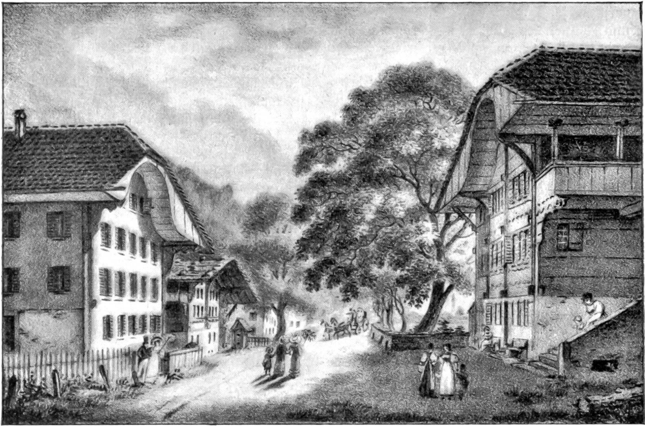
Der Höhweg in Interlaken um 1830 (Pensionen Mühlemann und Ritschard, heute Métropole, Confiiserie Schuh) nach einer Lithographie von F. N. König.

Heute ist die ganze Ebene zwischen Rugen und Harder mit Häusern besät, das kleine Dörfchen auf der linken Aareseite ist zur ausgedehnten Hotelstadt geworden, und das alte Städtchen Unterseen wirkt nur noch als bescheidener Vorort. Die beiden jahrhundertelangen Rivalen sind zu einer Einheit zusammengewachsen, durch breite Brücken und die Straßenbahn verbunden, und friedlich fließt die Aare, die sooft Anlaß zu blutigem Streit gegeben, zwischen ihnen hindurch. Das Städtchen Jnderlappen oder Interlaken, wie es erst genannt wurde, ist eine Gründung der Freiherren von Eschenbach, die im Jahre 1279 von Rudolf von Habsburg dazu die Erlaubnis erhielten; es hat dann seinen Namen bescheiden verdeutscht und ist auch in der Folge ein hübsches altdeutsches Städtchen geblieben, während die gegenüberliegende Klosteriedelung bei ihrem stolzen lateinischen Namen blieb und damit ihre internationalen Ambitionen dokumentierte.