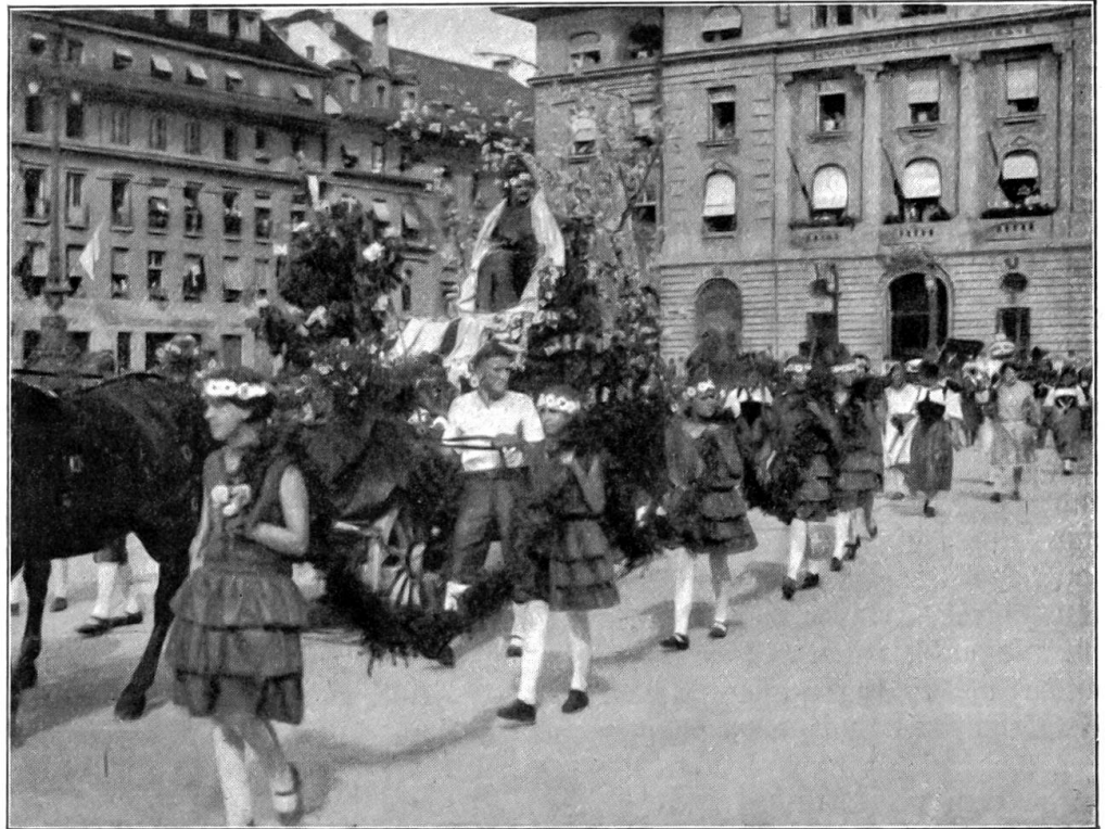
Gruppe vom Umzug bei Eröffnung der „Saffa“ in Bern. September 1928.

„Wie kann man denn an diesem verbeulten, aschgrauen Kübel so den Narren gefressen haben,“ machte neckend der Alte. „Wenn's die Leute haben, wissen sie nicht, was sie allerlei essen und anfangen wollen vor Heißelnäsigkeit und Übermut. Und also kommen sie gar noch dazu, den