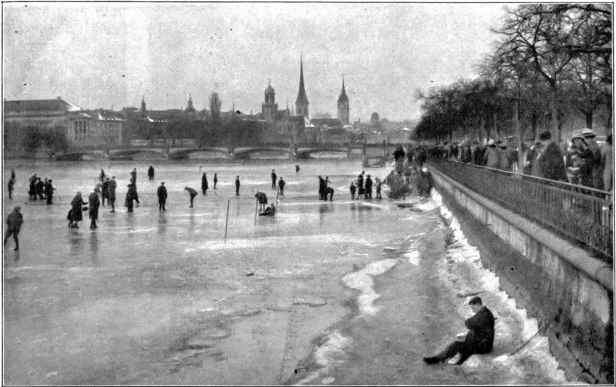
Seegefrörne Zürich. Februar 1929.