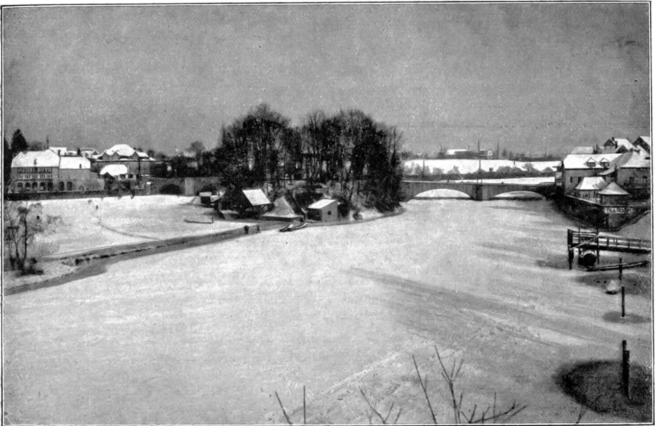
Der gefrorene Rhein bei Rheinfelden. Februar 1929.