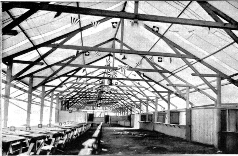
Der Schießstand des eidg. Schützenfestes in Bellinzona, vor dem Sturm. Juli 1929.

Also rief das alte Bergbäuerlein die Wirtin, zahlte und machte sich, zur Verwunderung seiner Talgenossen, gegen die Stubentüre. „Wart, Töni!“ lärmte der Stachisebel, „hoch noch ein Zeitchen zu, ich komme auch bald. Wir haben ja den gleichen Heimweg, dann haben wir Gespanen.“ Aber der Bläsiwifeltöni spielte dasmal den Gehörübel. Er nahm die Türe sachte hinter sich zu und machte sich alsdann, nachdem er im Geschirrladen einen dickbauchigen, himmelblauen Krug um billiges Geld erstanden hatte, rasch aus dem Dorf und hintertalwärts. Und nun richtete er aber seinen Heimweg so ein, daß er bei des Karlimartschenmoosbodenfels frischverheiratetem Franzdominel vorbeikommen konnte.