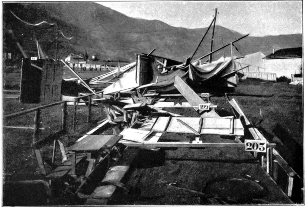
Der vom Sturm zerstörte Schießstand des eidg. Schützenfestes in Bellinzona. In fünf Tagen wurde der Stand rechtzeitig wieder aufgebaut. Juli 1929.

Ein Richern. Aber der Moosbodenfranzdominell ist ziemlich mißstimmt aufgestanden, nachdem er sein Wiseli widerwillig von den Anien gebracht hat. „Ja, willkommen zu uns,