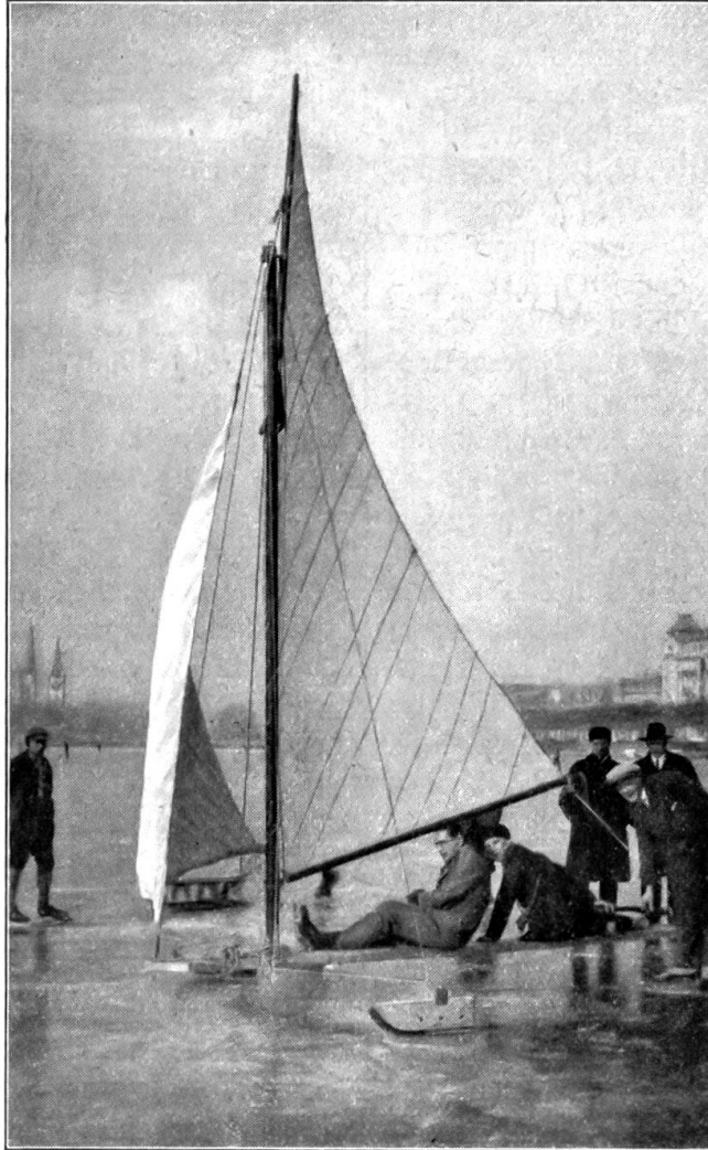
Segelschlitten auf dem gefrorenen Zürichsee. Februar 1929.

ungrad sein. Was schadet das dir und mir,“ wandte sie sich gradaus und munter an den immer noch erstaunt auf sie glühenden Franzdominel, „wenn aus einem Brunnen zwei Tropfen nebenaus in den Schnee fallen? Es ist mit den Küssen wie mit den Sternen: Es mögen ihrer vom Himmel fallen soviel als