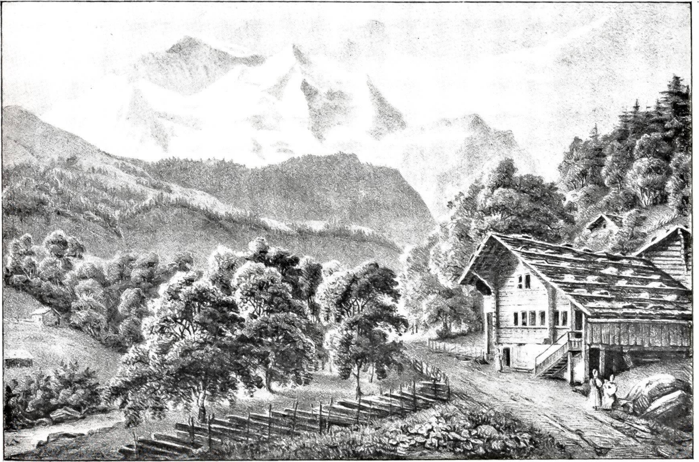
Jungfrau und Lauterbrunnental. Nach einer alten Lithographie.

Statthalter Berns in der Burg gewohnt haben, er wird aber bald den bequemeren Amtssitz Unterseen vorgezogen haben, und die verlassene Burg ging schnell dem völligen Zerfall entgegen und geriet in Vergessenheit, bis die Hirtenfeste ihrem Namen wieder weithin einen guten Klang verliehen. Als im Jahre 1812 die Gemahlin des französischen Marschalls, des Herzogs von Ragusa, sie käuflich erwarb, mag sie auch der romantische Nimbus, der die umspinnenen Burgtrümmer umgab, dazu bewogen haben. Heute stehen von der stattlichen Burg nur noch die Reste eines viereckigen und eines daran angebauten runden Turmes, aber trotzdem gehört Unspunnen zu den bemerkenswertesten Ruinen des Bernerlandes, viel besungen und oft gemalt, und man muß es fast bedauern, daß sie immer tiefer und unscheinbarer in die Baumwipfel versinkt.