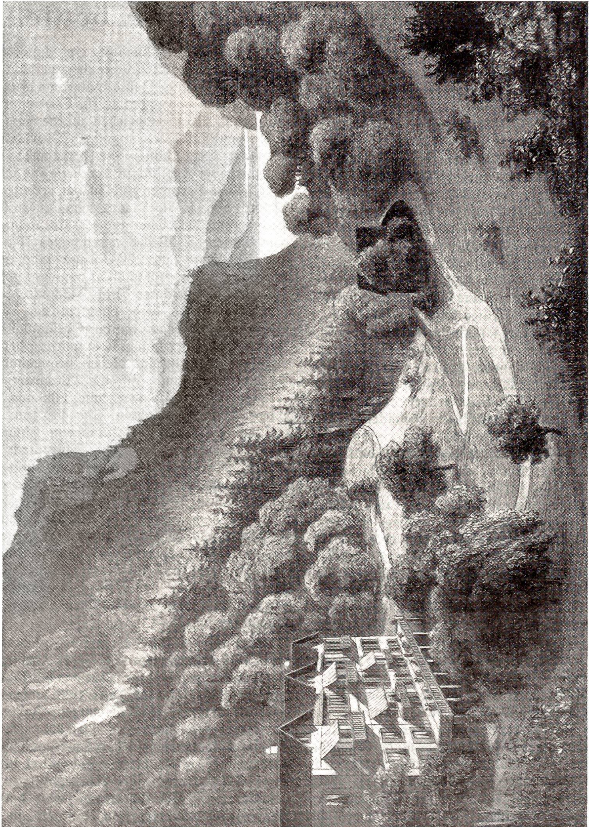
Das Hotel Gießbach um 1870.