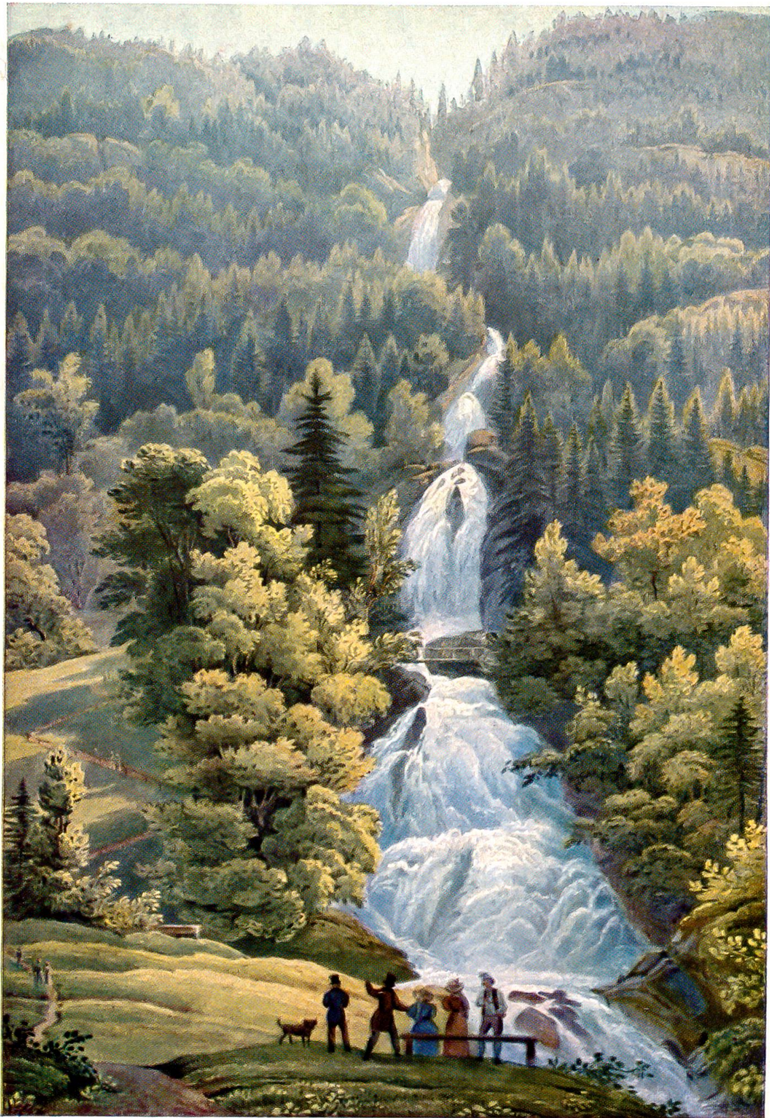
Die Gießbachfälle mit dem Kehrlibänklein nach einem Aquarell von S. Corrodi um 1830