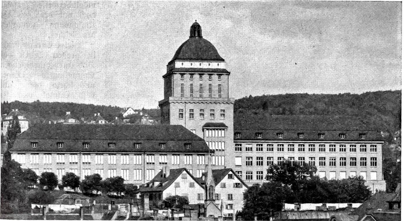
Die neue Universität in Zürich.