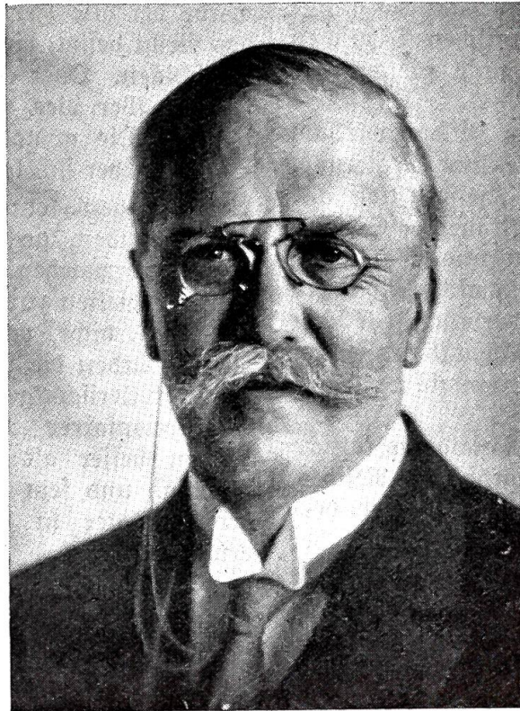
Edmund Schultheß. Bundespräsident für das Jahr 1933.

Von Papen wurde Reichskommissar von Preußen. Das Reichsgericht, das die verjagte sozialistisch-katholische Regierung anrief, fällt nur einen lahmen Entscheid, der gegenüber der Entwicklung nichts bedeutete. Im November brachten die Reichstagswahlen nur eine kleine Verschiebung nach links, indem Zentrum und Kommunisten zunahmen; man hätte glauben mögen, daß Hitler aufgehalten sei. Papen wurde