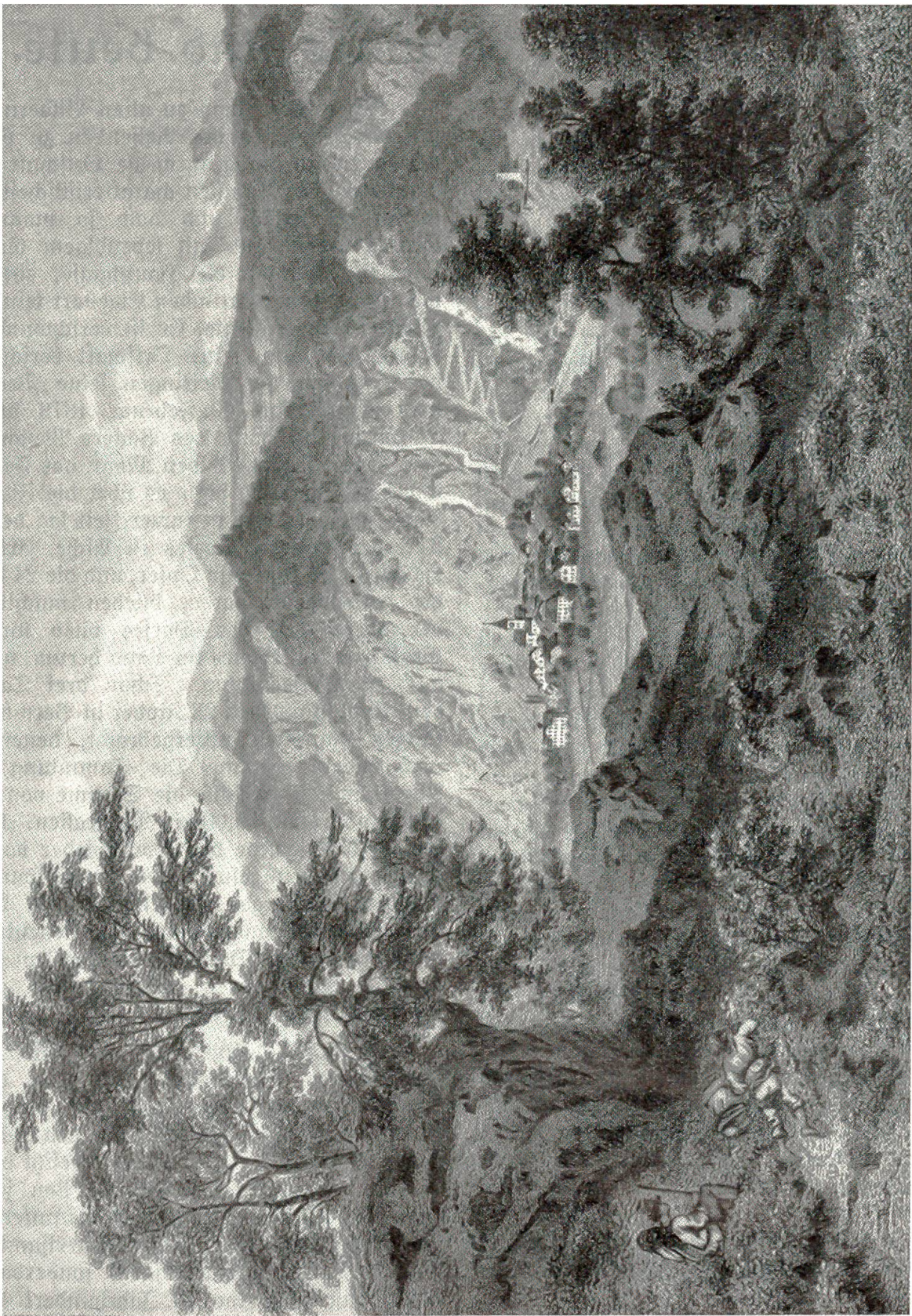
Meiringen. Nach einem alten Stich.