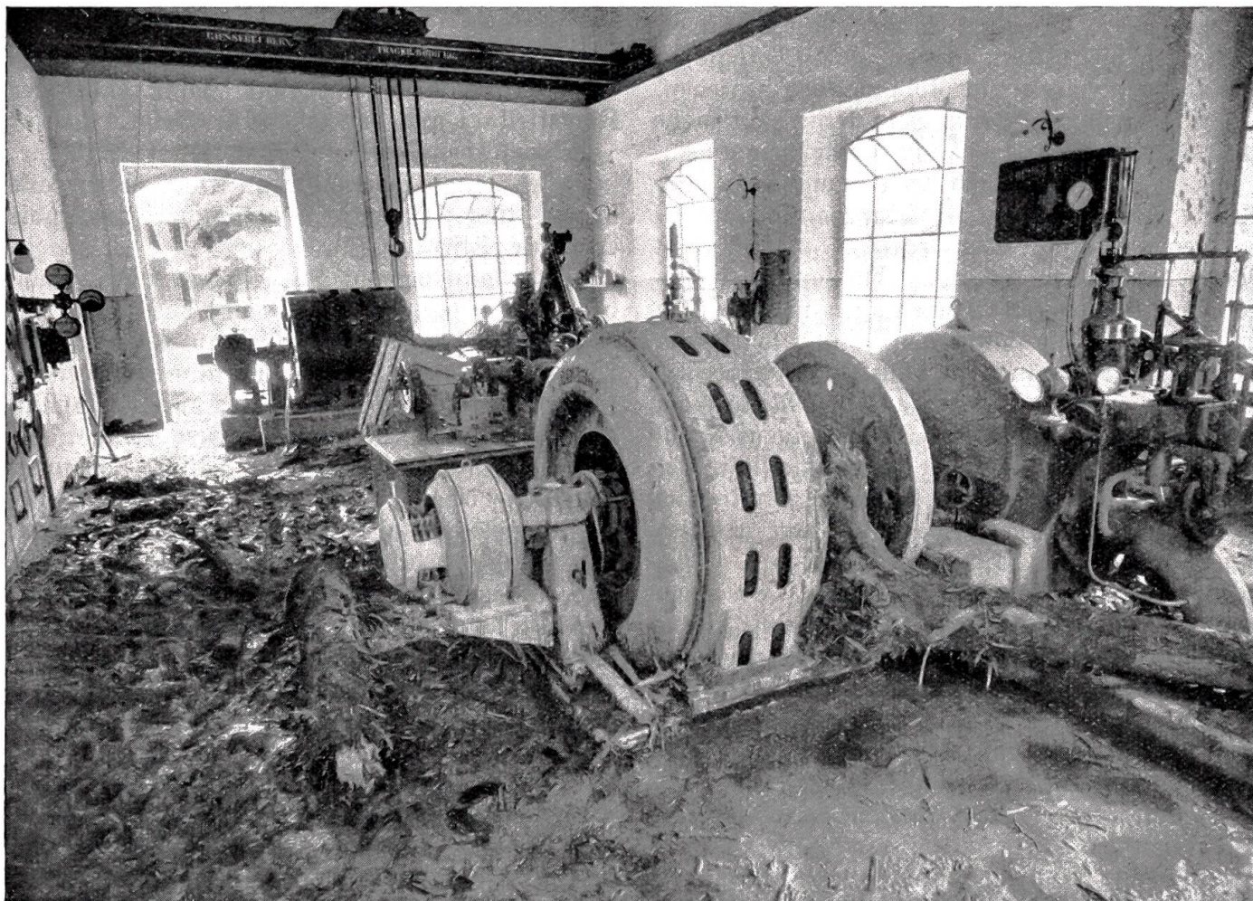
Unwetterkatastrophe im Lauterbrunnental. Maschinenaal des Elektrizitätswerkes Stechelberg.

„Ja, Setti, was ich sagen wollte: Ich danke dir auch noch vielmals für den Braten und für das Aufräumen. Es wäre ja nicht nötig gewesen...“