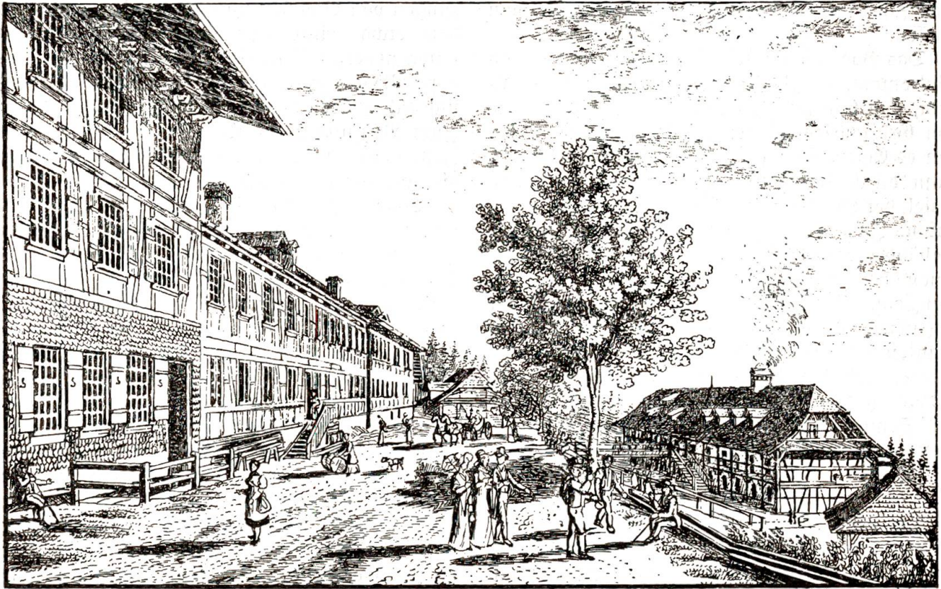
Das Gurnigelbad um 1830.

die jede 10, 20 Schritte stille stehen müssen, um wieder zu Athem und Kräften zu kommen.“ Die Badgebäude, auf einer zum Teil künstlichen Terrasse errichtet, wuchsen durch Umbauten nach und nach in die Länge und boten schon am Ende des 18. Jahrhunderts den originellen Anblick einer städtischen Häuserzeile. Aus dem Walde wurde das Wasser durch Dünkel in die Öfen und in die