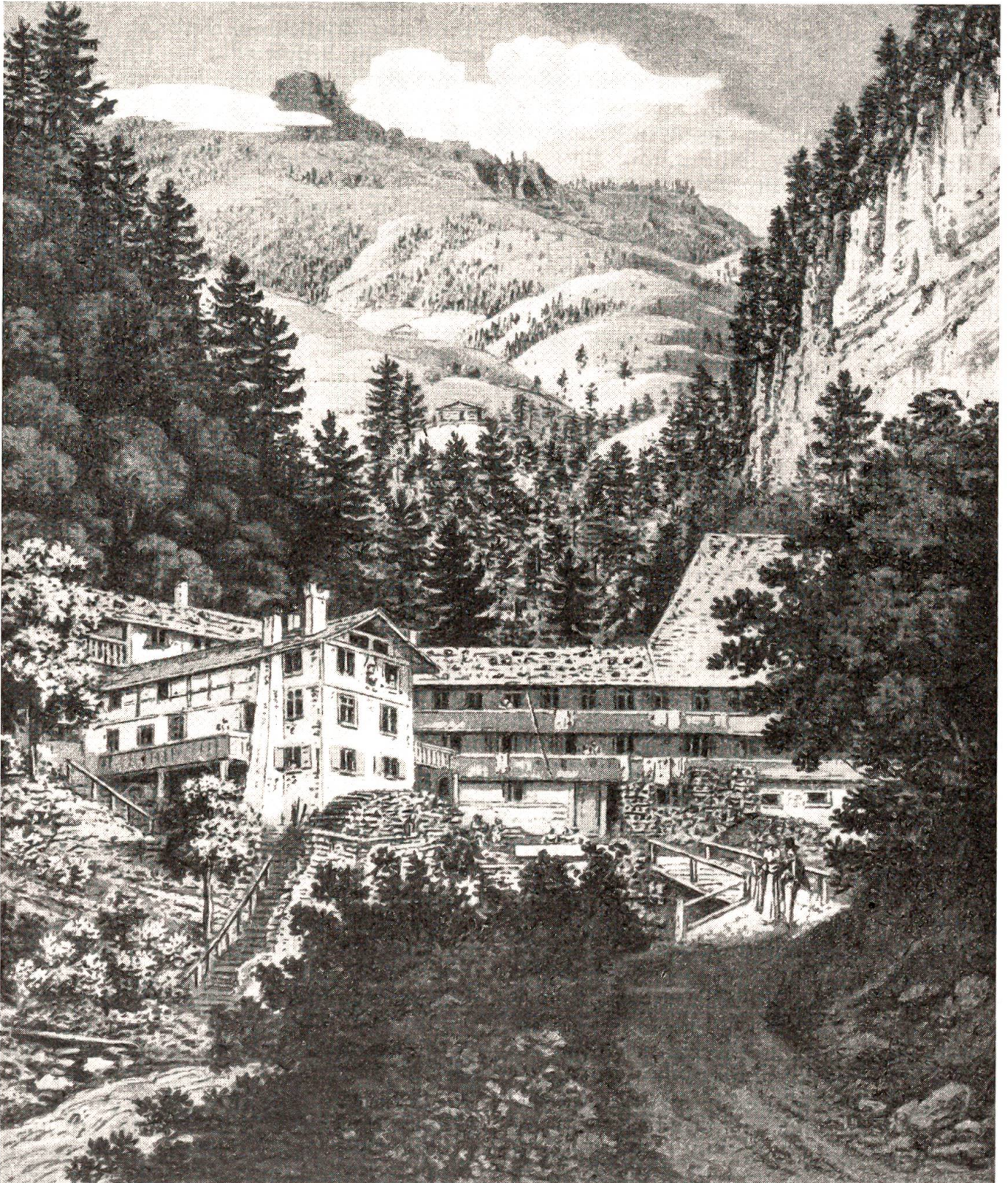
Das alte Bad Weißenburg im Anfang des 19. Jahrhunderts.