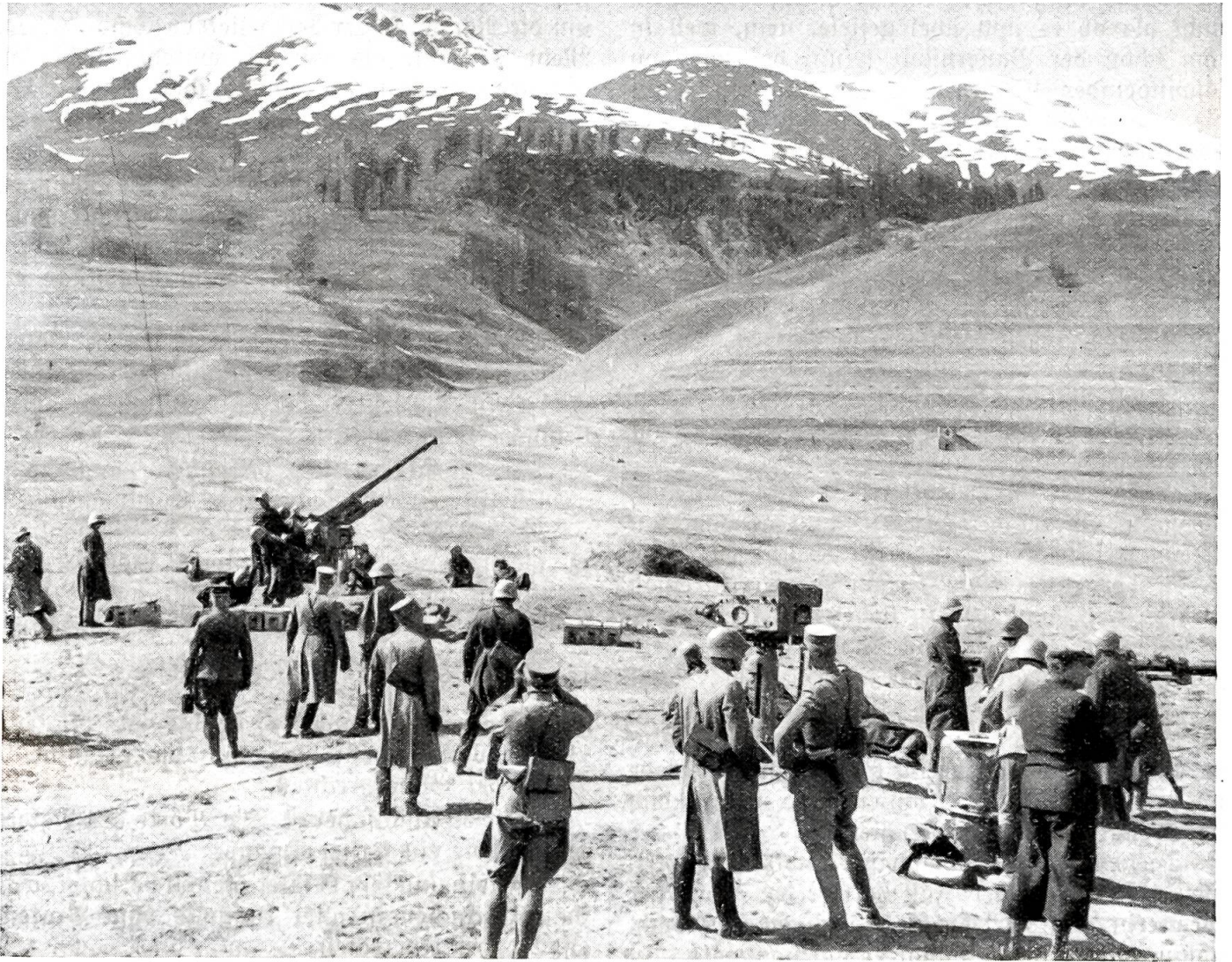
Fliegerabwehrschießen im Gebirge.