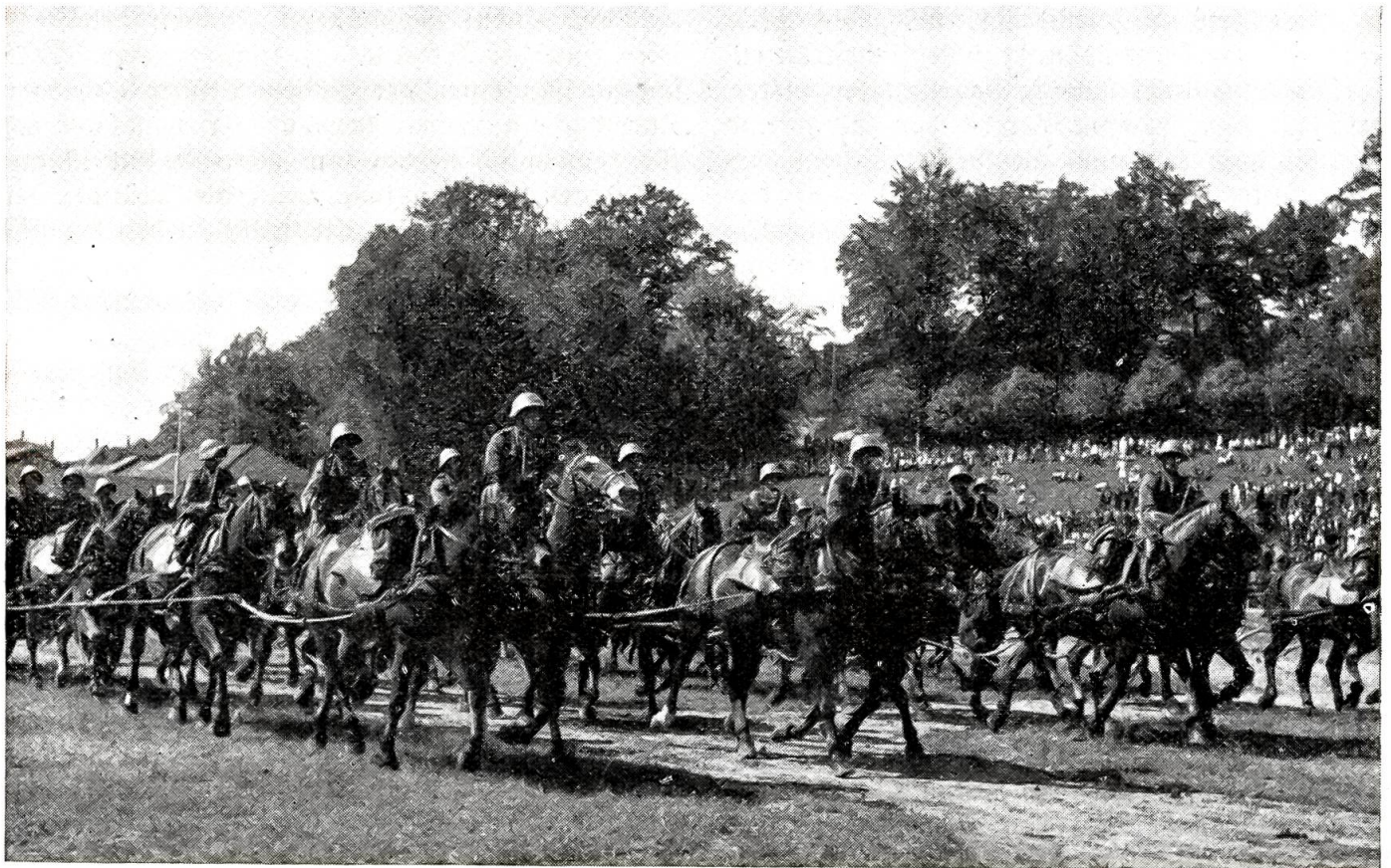
Artillerietag in Lausanne im Juni 1938.