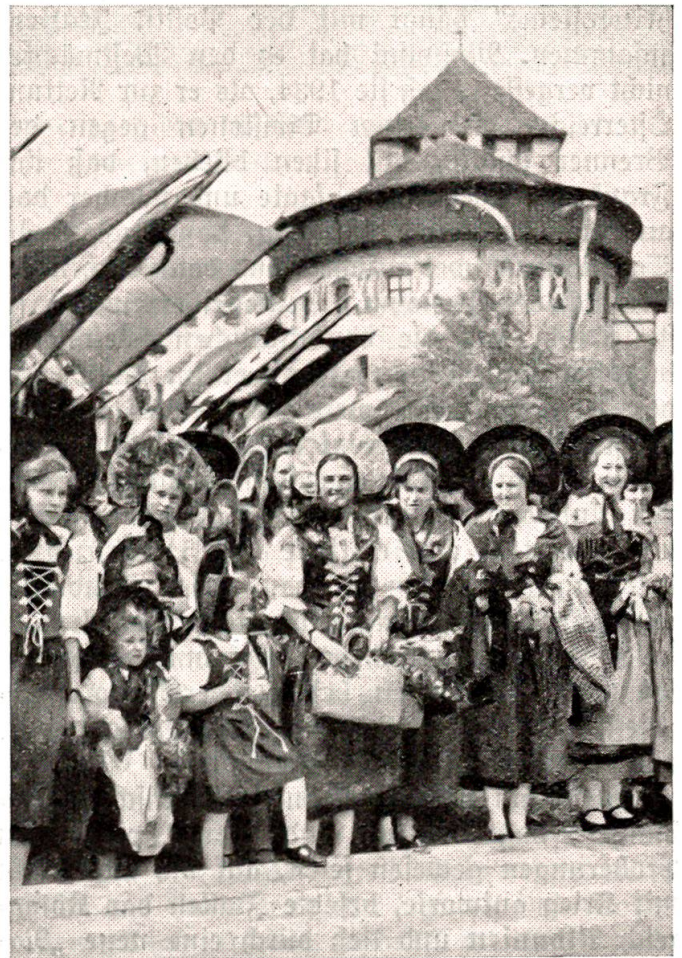
Festtage in Liechtenstein, Trachtengruppe.

Als nach einer plötzlichen vertraglichen Abmachung zwischen dem Reiche und Litauen auch