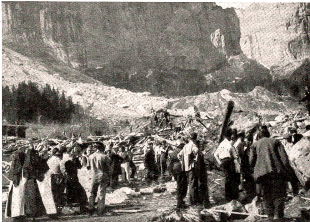
Felssturz bei Tidaç, 10. April 1939.

Die Frage einer aktiven Teilnahme Spaniens im Block der Achsenmächte ist aber nicht ent=