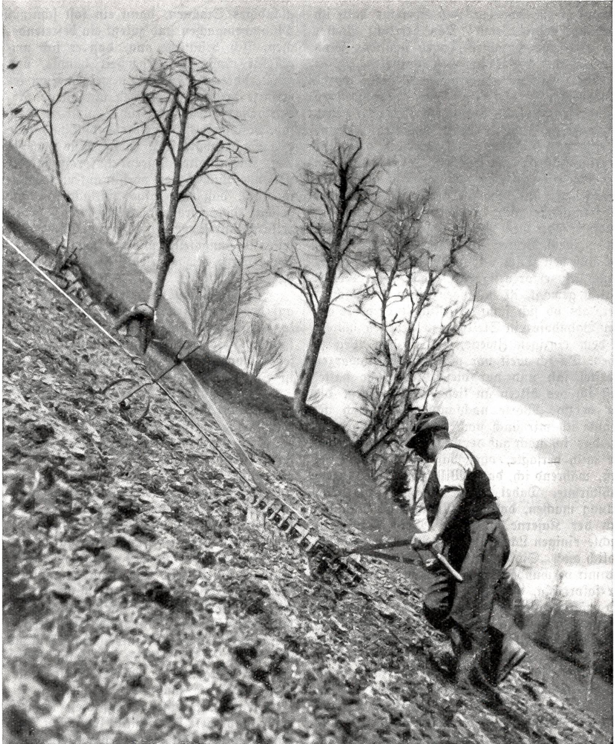
Der Uder am Steilhang.