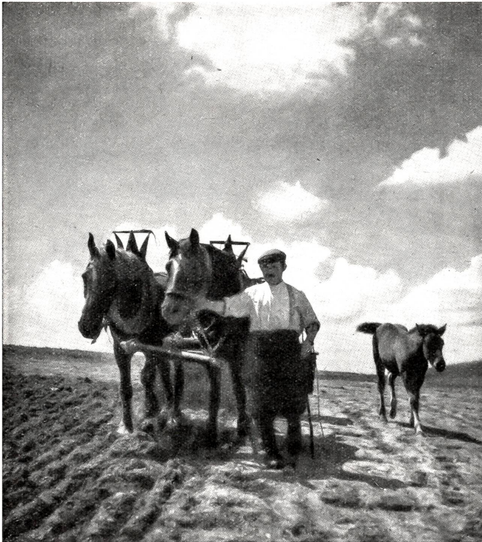
Über die Saat zieht der Bauer in unermüdlicher Arbeit seine Walze.

zu, um so weniger, als der Hauptmann gleich darauf sagte: „Ausgang bis 10 Uhr.“