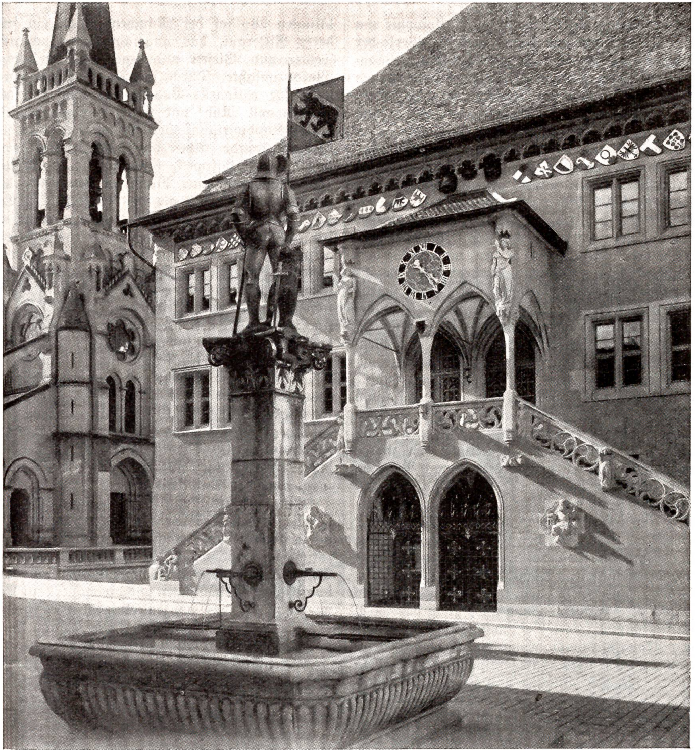
Die stilvoll renovierte Hauptfassade des Berner Rathauses.