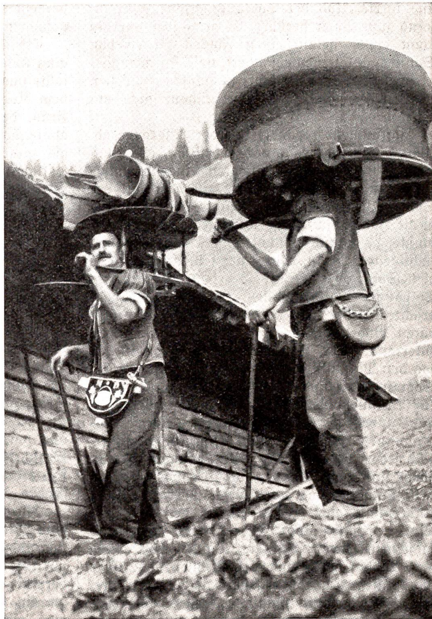
Bei den Sennen im Grenerzer Land. — Die Sennen beziehen im Gastlosengebiet eine neue Alp.

Aber nun war es, als hätte Emil, der Dumme, sein ganzes, nutzloses Leben lang nur auf diesen Augenblick gewartet, um sich mit einer stumpfsinnigen Hartnäckigkeit an die Schutthaufen, an die Strünke und Steine zu machen. Den ganzen