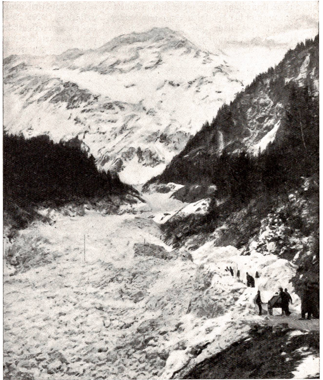
Großer Lawinnenniedergang an der Grimselstraße, 4. April 1943.

die Deutschen auch an der Zentralfront über die letztjährige „Winterlinie“ hinaus strategisch wichtige Gebiete aufgeben müssen, was in Berlin gelegentlich als „Frontbegrädigung“ bezeichnet worden ist. Wesentliche Veränderungen der Frontlinie waren seit dem Monat März nicht mehr zu verzeichnen; beide Kampfparteien haben jedoch umfangreiche Verstärkungen herangeführt,