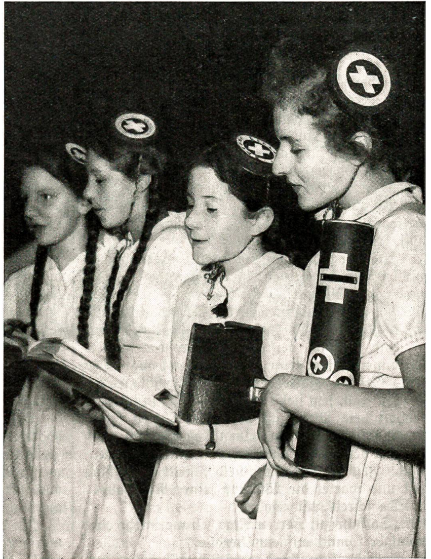
Tag der Einstellung der Feindseligkeiten Junge Sammlerinnen für die Schweizerpende

Lisi fährt zusammen wie von einer Schlange gebissen. Mit fliegender Hand wischt es die Tränen aus den Augen. Jetzt war nicht Zeit zum