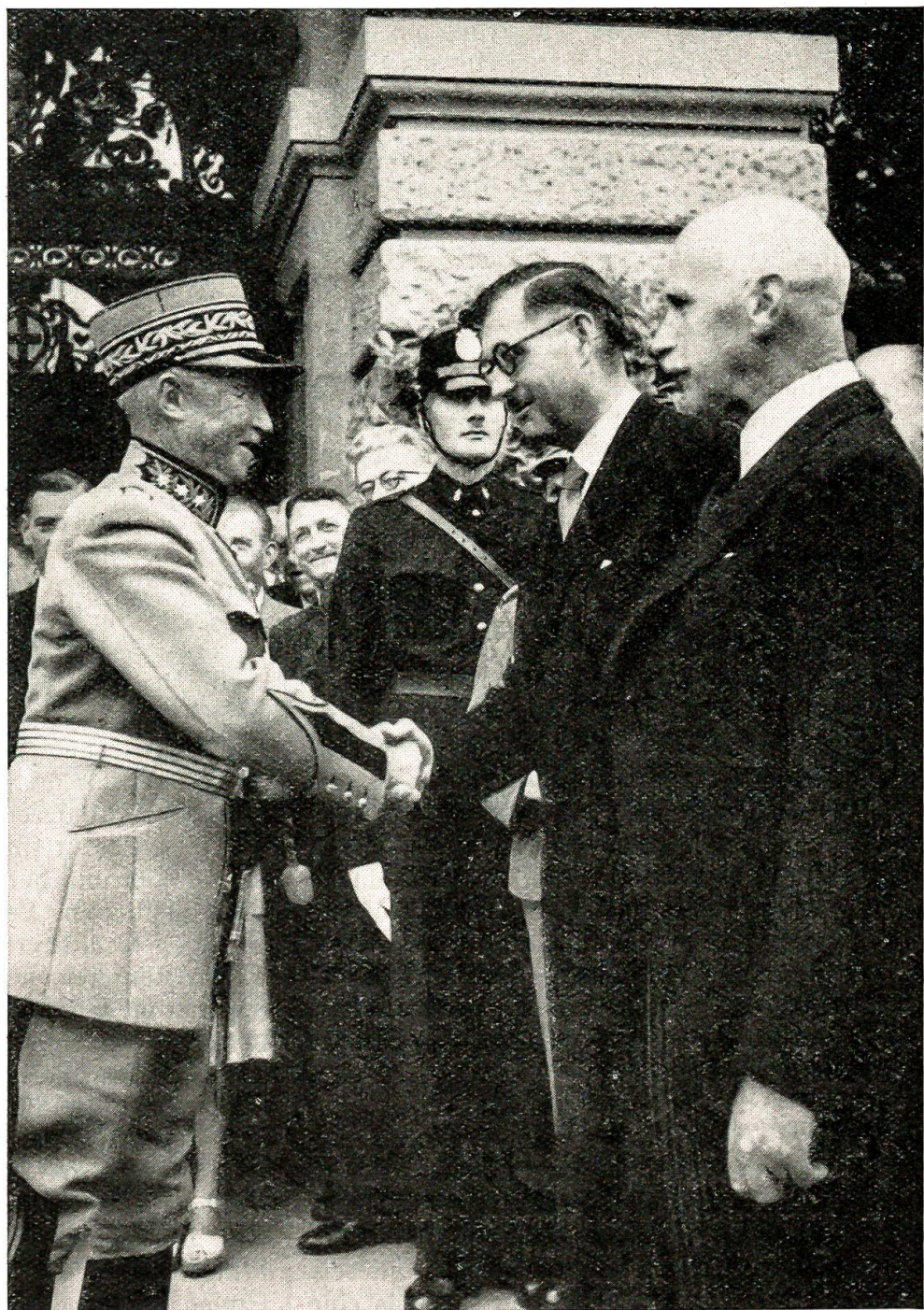
Abschied des Generals vor der Vereinigten Bundesversammlung, Mittwoch, den 20. Juni 1945. General Guisan verabschiedet sich vor dem Bundeshaus von Bundesrat Kobelt und Nationalratspräsident Nebj (rechts).

mit der Begründung abgelehnt, daß die Kapitulation bedingungslos gegenüber allen Alliierten,