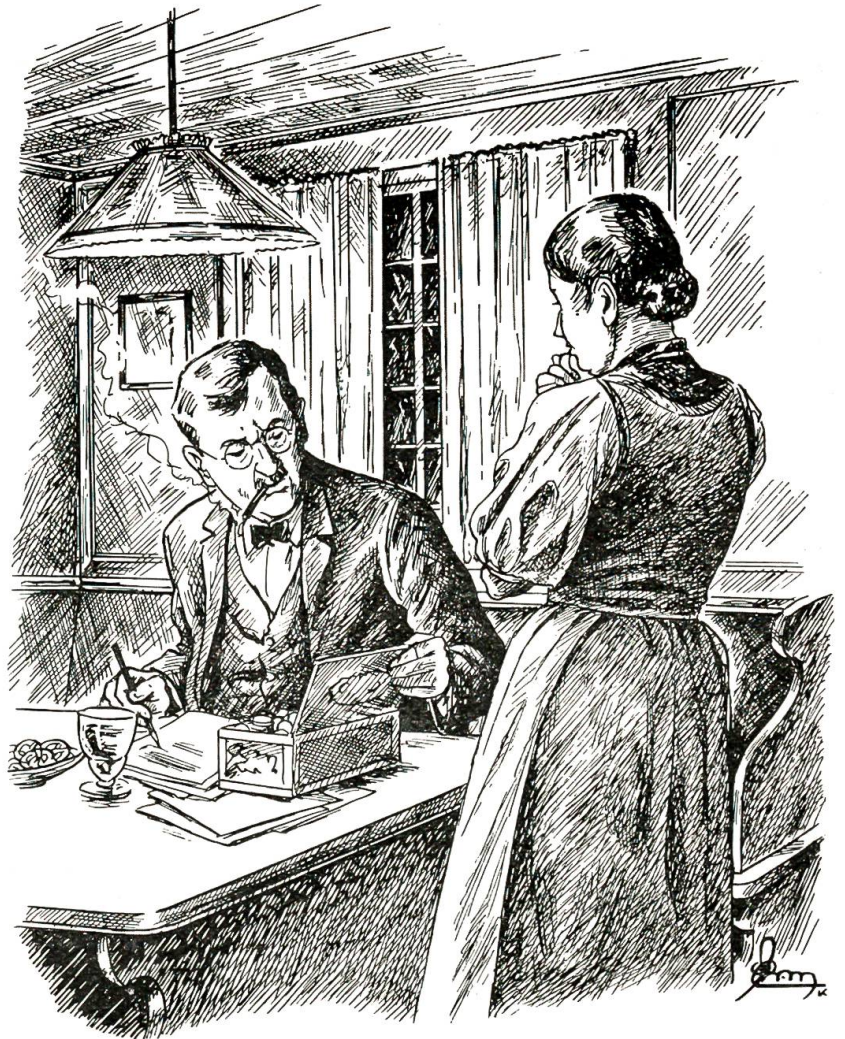
„Boß Strahl und Hagel!“

„Ja nun — eigentlich wollte ich gar nicht mehr davon reden“, besann sich der Gemeindegemeinderat noch einmal, fuhr aber dann doch fort: „Schau — du weißt ja, nun bin ich schon gut ein halbes Duzend Jahre Witwer und habe auch sonst niemand weit und breit. Und wie es mit den Haushälterinnen ein Verding ist, das siehst