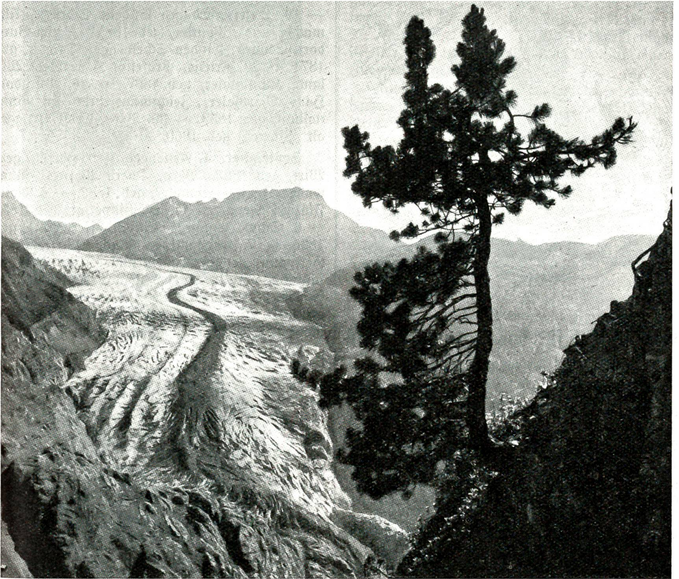
Blick von Belalp auf den Aletschgletscher