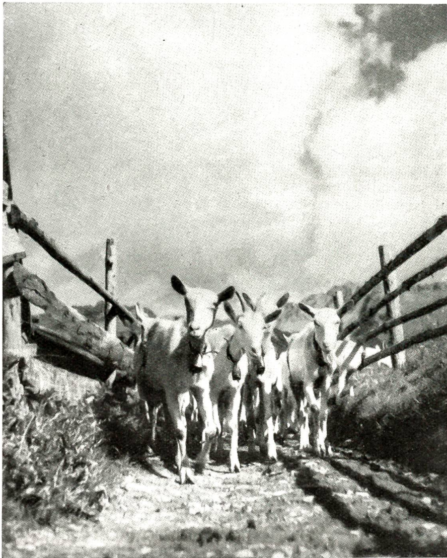
Ziegen im Simmental ziehen zur Weide bergwärts.

Südfront als sichere, weiter rückwärts in den Bergen liegende Nach- und Rückschubslinie, als Ersatz und Ergänzung für Grimsel und Furka.“ Unmöglich, daß in Zeiten, die dem Lande derartige Perspektiven aufdrängten, der endliche Ausbau des Susten noch zu verzögern gewesen wäre! Auf Grund des Alpenstraßenprogramms konnte denn auch sehr rasch gehandelt werden. Zusicherung der überaus hohen eidgenössischen Subvention, Volksabstimmung in den Kantonen Bern und Uri mit überwältigendem Mehr zugunsten des Baues (86 748 gegen 19 656 Stimmen im Kanton Bern, 4136 gegen gar nur 268 im Kanton Uri), Beginn der Arbeiten, nach siebenjähriger Arbeit Vollendung der Straße: alle diese Termine scheinen heute, im Rückblick auf das Erreichte, wie auf einen einzigen Jahres- oder Tageslauf zusammengedrängt, gleichsam als hätte man einen spannenden Dokumentarfilm im Bliztempo ablaufen lassen.