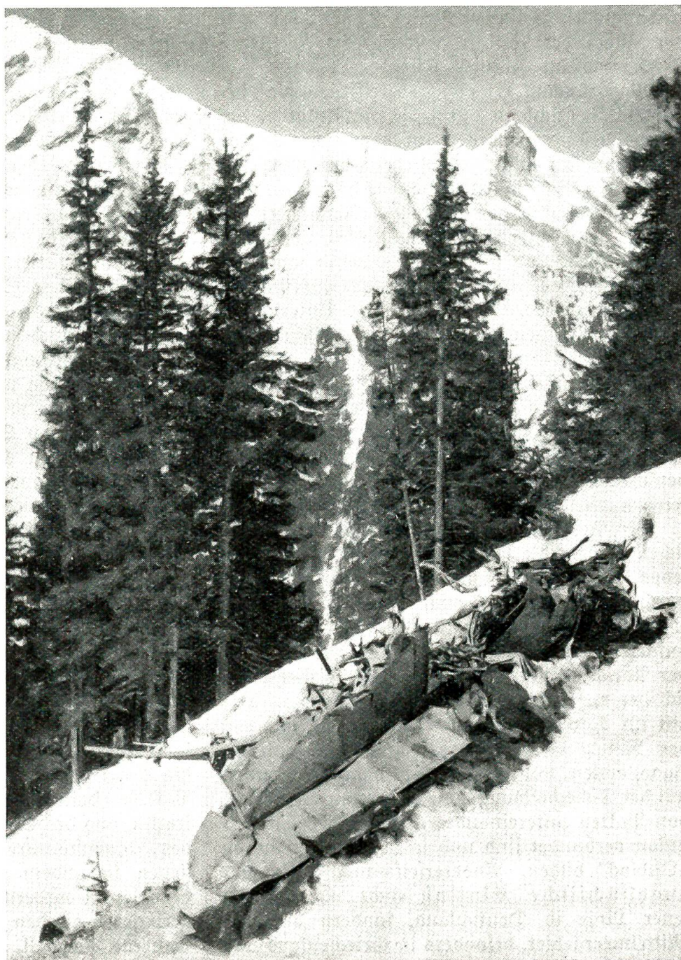
Eine Gruppe von vier Militärflugzeugen stürzte im Grimselgebiet bei Guttannen ab. Am steilen Berghang des Benzlauistockes konnten die Flugzeugüberbleibsel mittelst einer improvisierten Standseilbahn zu Tal gebracht werden.

ihre im Krieg neu erlangten machtpolitischen Positionen zu festigen und auszubauen. Könnten diese Ansprüche allein auf Kosten der Besiegten