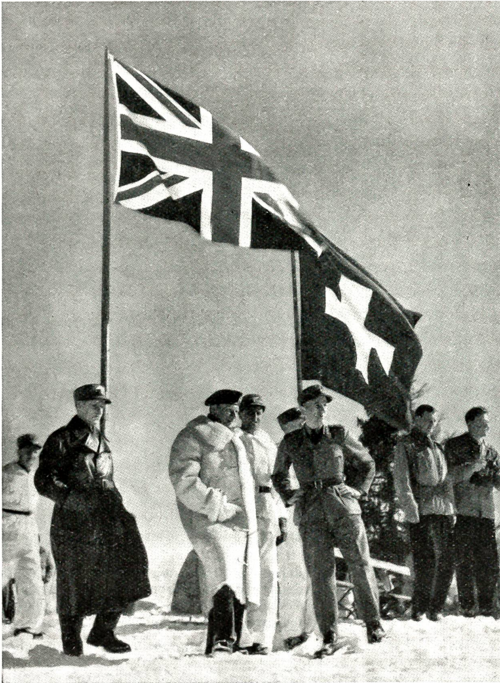
Feldmarschall Montgomery auf dem Gstaader Feldherrenhügel