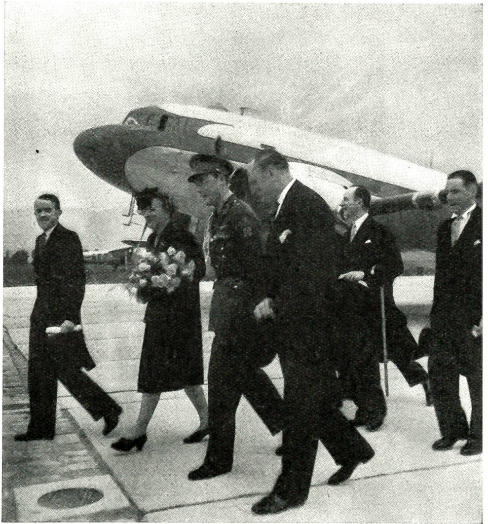
Prinzessin Juliane und Prinz Bernhard der Niederlande auf offiziellem Besuch in der Schweiz. Auf dem Flugplatz Cointrin in Genf werden die Gäste von Bundesrat Petitpierre (links) und dem holländischen Gesandten in der Schweiz, Minister Bosch v. Rosenthal (rechts vorne), empfangen.

Im übrigen sind die für die Zukunft wichtigen Entscheidungen bisher noch nicht im Rahmen der UNO gefallen, sondern in jenen Konferenzen, in denen die siegreichen Großmächte im engsten Kreise und hinter verschlossenen Türen berieten. An erster Stelle ist hier die Konferenz von Potsdam zu nennen. Sie wurde am 17. Juli zwischen Truman, Churchill, der nach den englischen Wahlen durch Attlee abgelöst wurde, und Stalin sowie ihren Außenministern und militärischen Beratern eröffnet und am 1. August mit einer grundlegenden Erklärung abgeschlossen. Diese enthielt Beschlüsse über die Einsetzung eines Außenministerrates der fünf Hauptmächte zur Vorbereitung der Friedensverträge, über die Behandlung Deutschlands und über seine Reparationsleistungen, über die Westgrenze Polens und die Abtretung Königsbergs an Rußland sowie über die Umsiedlung der Deutschen aus Polen, der Tschechoslowakei und Ungarn. Die sich hier abzeichnende Tendenz, die Hauptfragen der neuen Friedensordnung ohne Befragung der kleineren