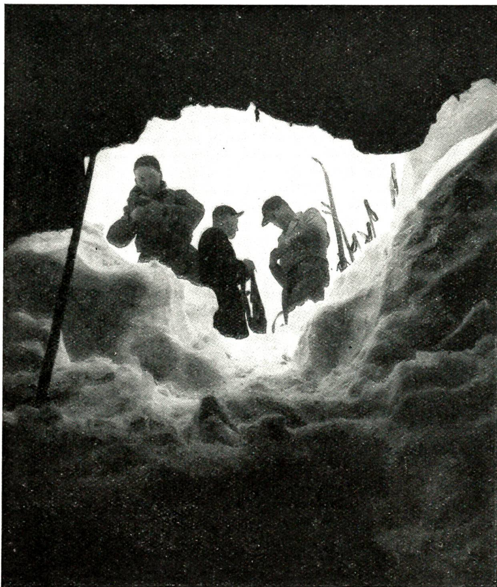
Zur Erforschung des sagenumwobenen Häliloches im Beatenberggebiet. Die Teilnehmer der Expedition treffen die ersten Vorbereitungen zum Abstieg. Der Steinschlaggefahr und des minimalen Wasserganges wegen wurde die Expedition im Winter durchgeführt.