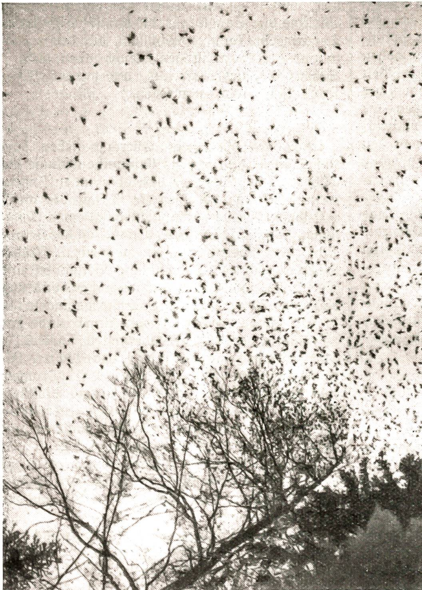
Seltene Invasion am Thuner- und Brienersee Millionen von Bergfinken sind aus dem hohen Norden bis an den südlichen Alpenrand vorgestoßen.