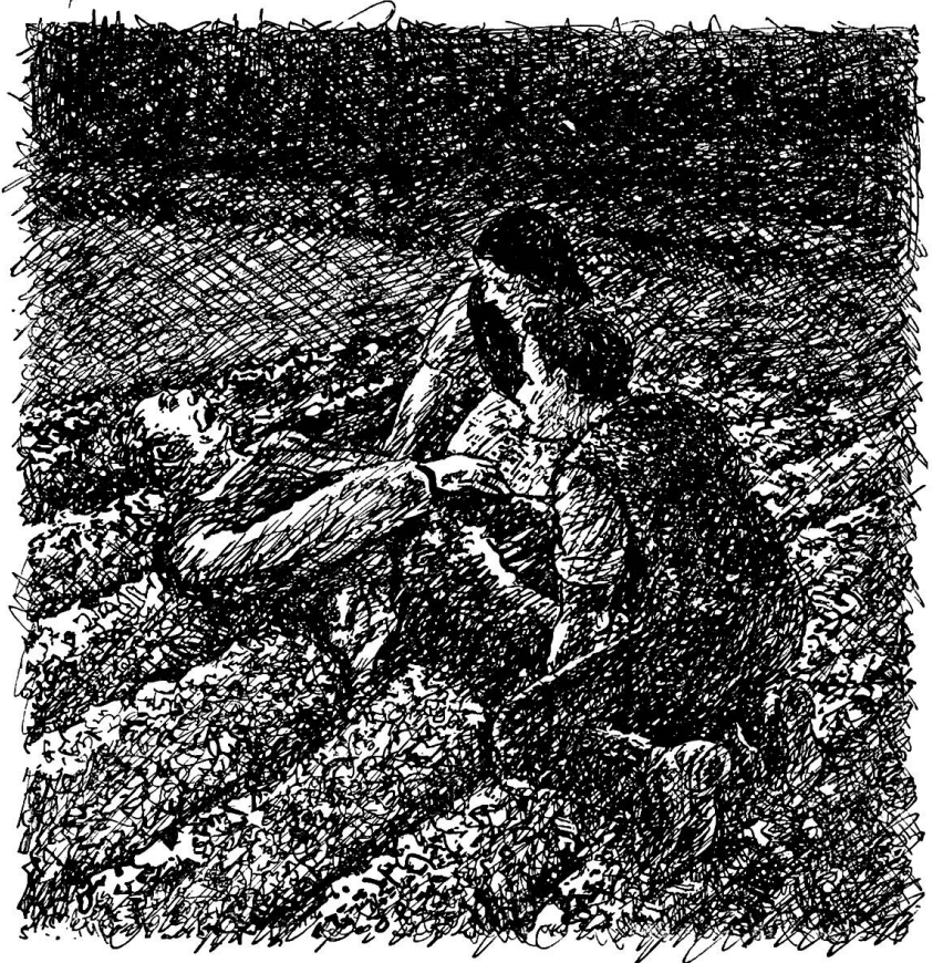
Jetzt kauern sie bei ihm.