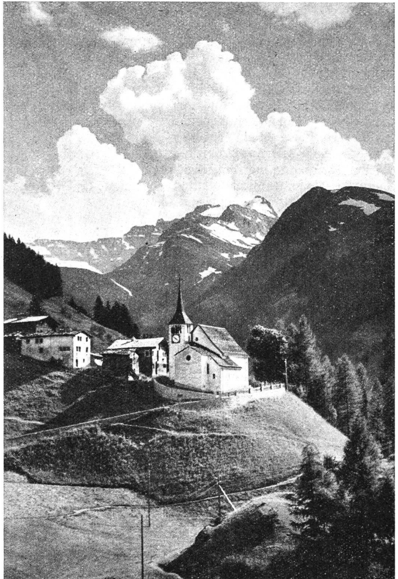
Kirche von Binn (Wallis)