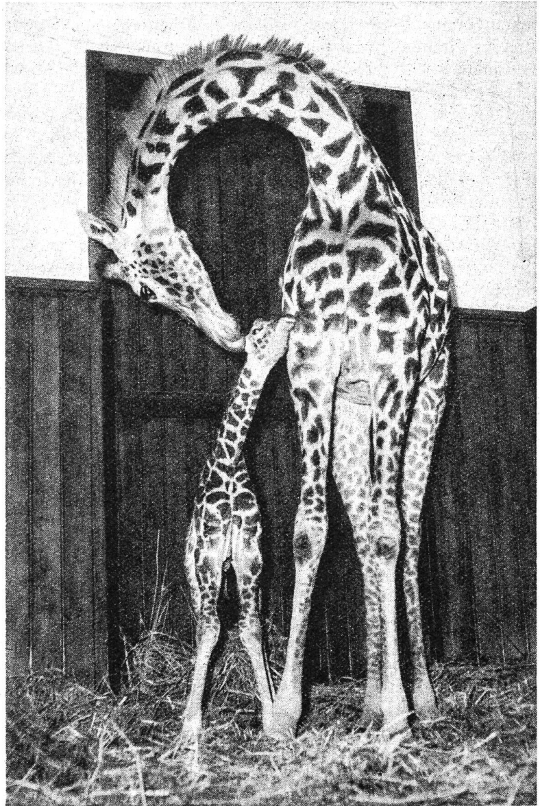
Seltener Nachwuchs im Basler Zoo

Seither verabschiedete sich Sibylle des Morgens