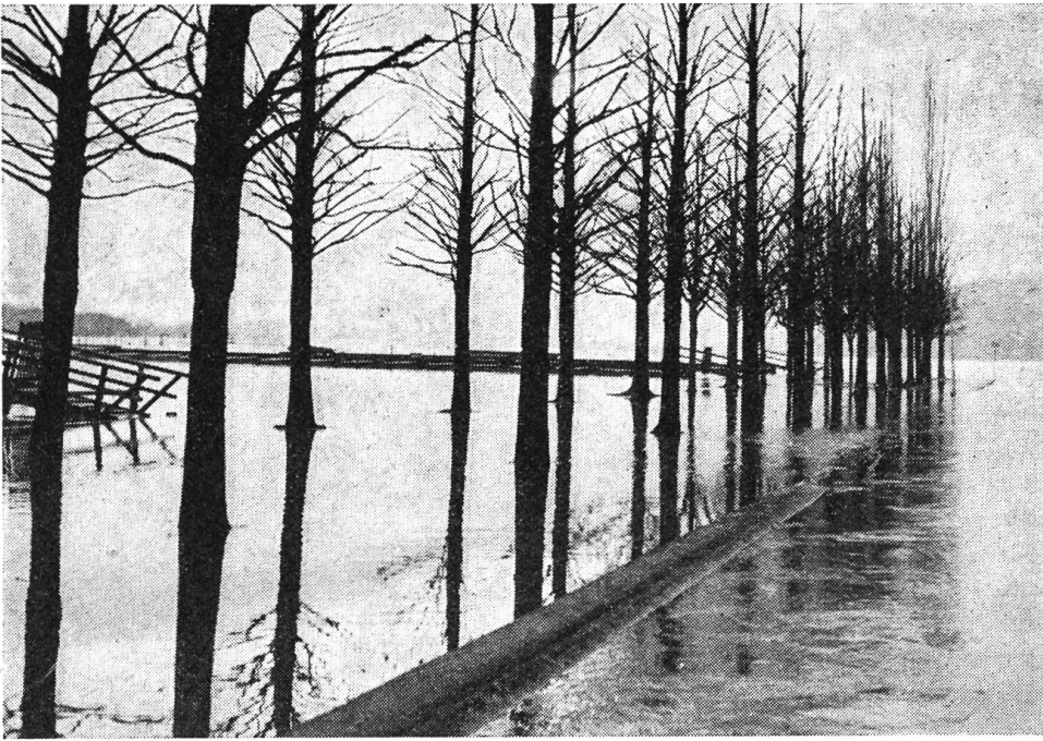
Im Januar 1955 trat der Bieler See über seine Ufer. Hier eine Allee im Bieler Seepark