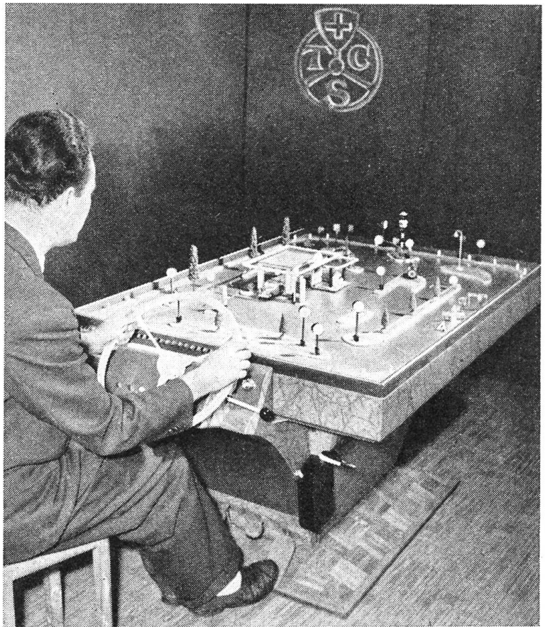
Fahren lernen ohne Auto Zwei Automobilisten aus Murten haben diesen Apparat konstruiert, mit dem das Autofahren, wenigstens teilweise, „auf dem Trockenen“ erlernt werden kann.

Nach dem offiziellen Einzuge statteten die Mitglieder des Kleinen Rats dem Botschafter im Ambassadorshofe einen Höflichkeitsbesuch ab. Am folgenden Tage erschien Bonnac mit eindrucksvollem Gefolge in der Ratsitzung im Solothurner Rathause und überreichte dem amtierenden