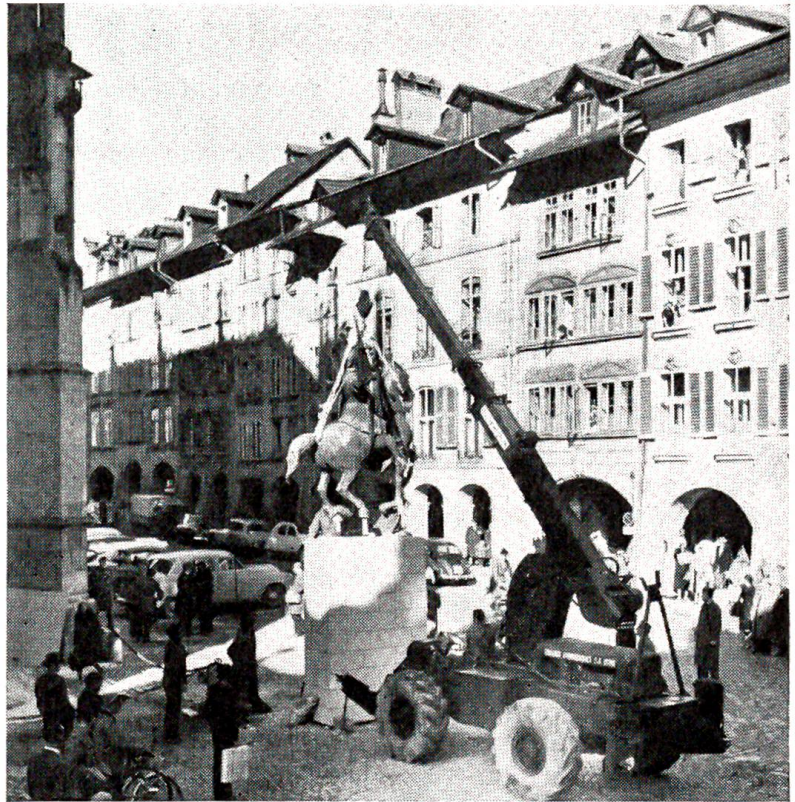
Gesucht: Ein neuer Standort für Rudolf von Erlach. Das Denkmal des Siegers von Laupen wird hier provisorisch an der Kirchgasse unterhalb des Münsters postiert. Der Entscheid über den definitiven neuen Standort ist noch nicht gefallen.