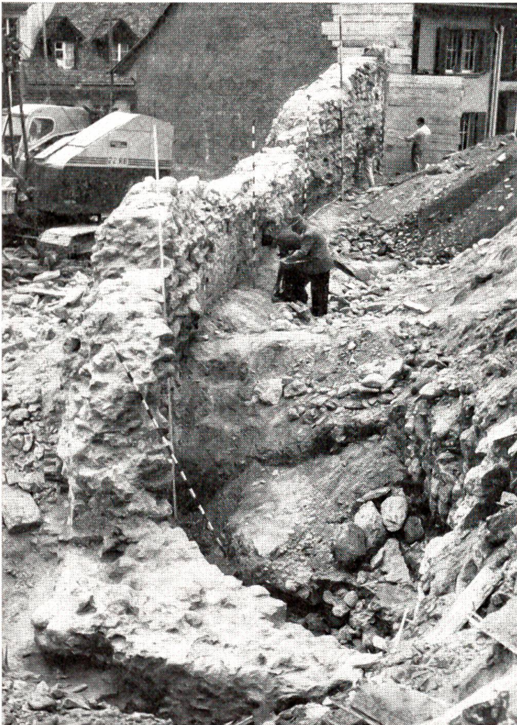
Die Ringmauer der Burg Nydegg

Großvaters Bella warf noch viele Wellen, und ich sehe sie noch immer gern. Nur meine Frau hat nicht mehr viel für sie übrig, seit wir Kinder haben. Sie ist