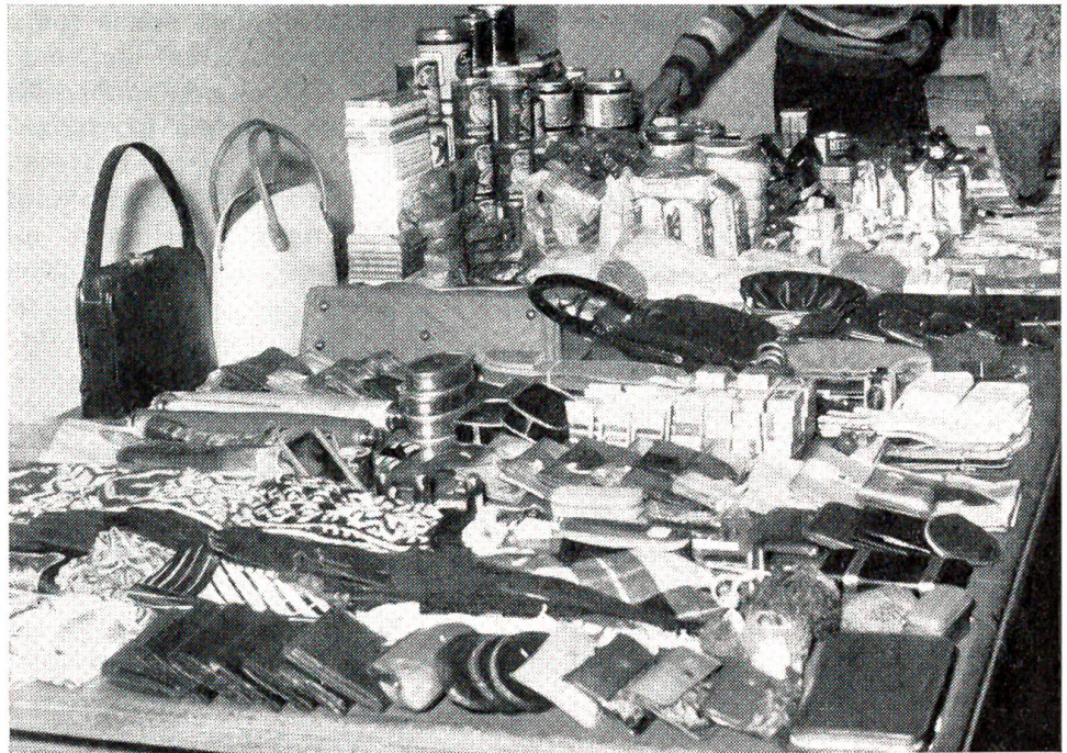
Alle diese Dinge hat eine krankhafte Diebin in Bern in relativ kurzer Zeit aus allen möglichen Läden zusammengestohlen.

Sachmann. Der sechsjährige Sohn eines Theaterdirektors muß zum erstenmal in die Schule. Wie er wieder nach Hause kommt, wird er gefragt, wie es ihm gefallen habe. Es hatte ihm gut gefallen. Und wo er denn sitze? – „Zweite Reihe Parkett!“