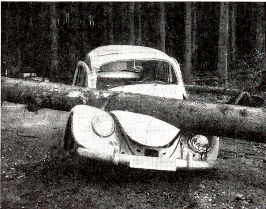
Um ein Haar dem Tod entronnen ist dieser Autofahrer. Beim Holzfällen fiel die Tanne anstatt parallel zur Straße quer darüber.

Die Hündin machte unverzüglich kehrt und ging knurrend zurück. Die Welpen trollten ihr nach, kamen dabei ins Spielen, balgten sich jaulend und