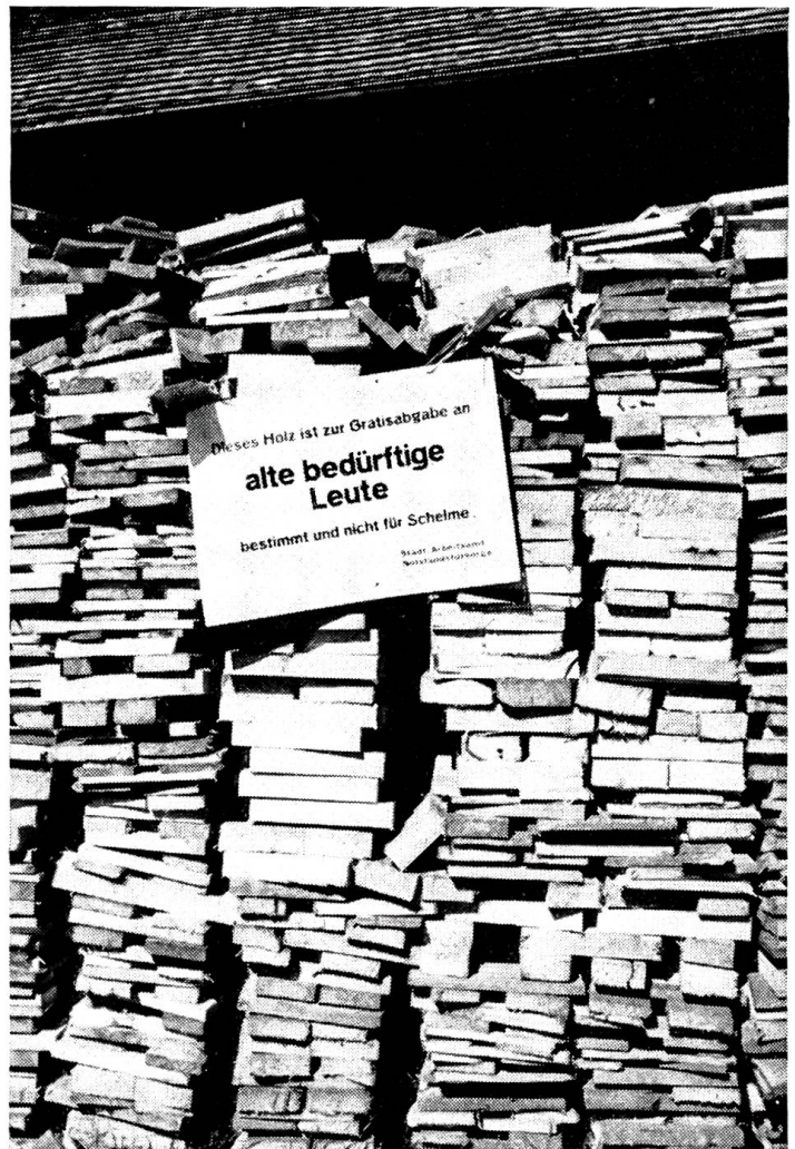
Wirksame Hinweistafel der Notstandsfürsorge Bern