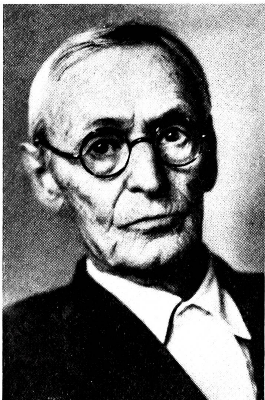
Dr. h. c. Hermann Hesse, Dichter und Schriftsteller, Montagnola