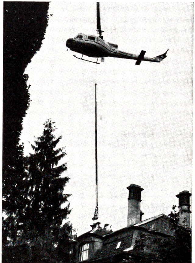
Immer mehr setzt sich der Helikopter für schwierige Transportaufgaben durch. Hier pflanzt er eine riesige Antenne auf das Verwaltungsgebäude des Touringclubs der Schweiz in Bern auf. Die Antenne dient der Funkverbindung mit den Pannenfahrzeugen des TCS.

Sebastian fand, das habe er verdient. Er wollte sich auch bessern. Nur das mit den Hennen kam ihm schwer an. Eier ass er fürs Leben gern, und wenn er sie fürderhin mit dem Herrn Statthalter teilen musste, und Jahr für Jahr ein Fasnachts-huhn und eins zu Martini abgeben musste, bösete es bei ihm daheim.