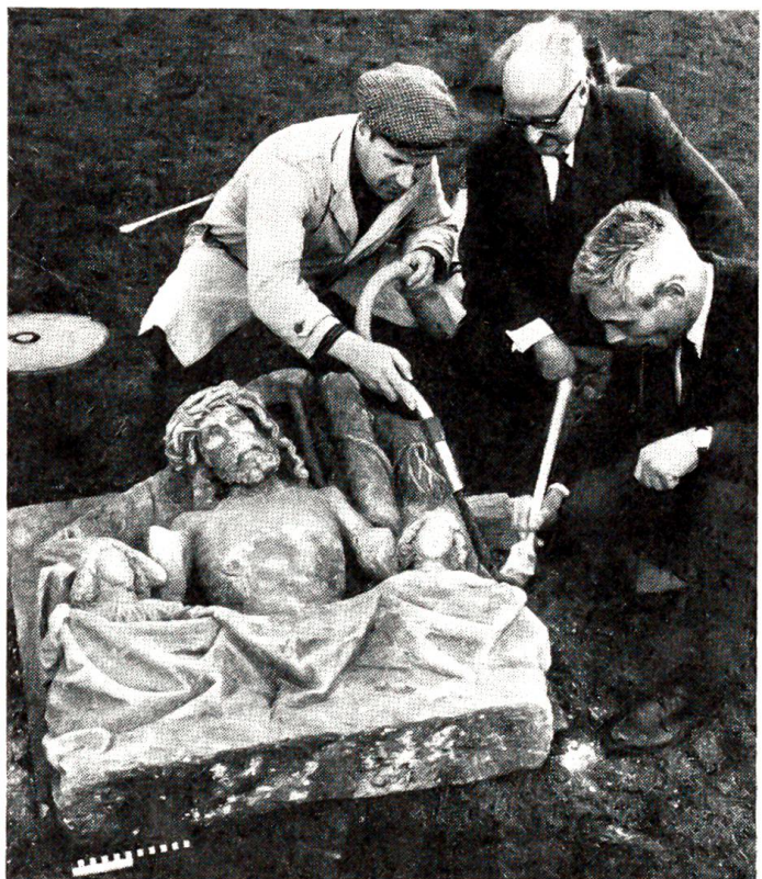
Überraschender Fund in Thorberg

Da lief der Geistliche, so rasch er konnte, zur nächsten Telegraphenstation, nahm Verbindung auf mit Klagenfurt, Graz und Wien, ruhte nicht, bis er einen Strafaufschub erwirkt hatte, und jedesmal sagte er: «Wer als Henkersmahlzeit eine