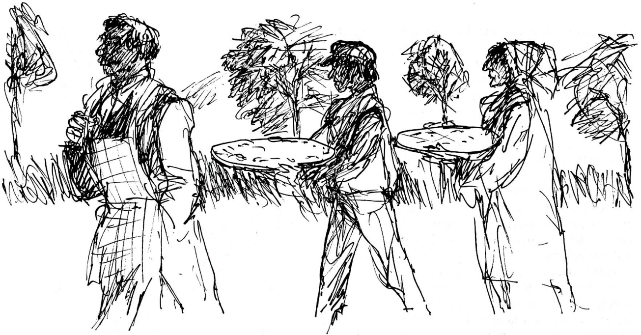
Grüebler schritt erhobenen Hauptes voran und murmelte zuweilen etwas von törichten Jungfrauen und Schlappschwänzen.

die geprellten Mitläufer lautlos, und von dem ganzen Spuk blieb einzig die Sage, die der Seelsorger arglos verbreitete.