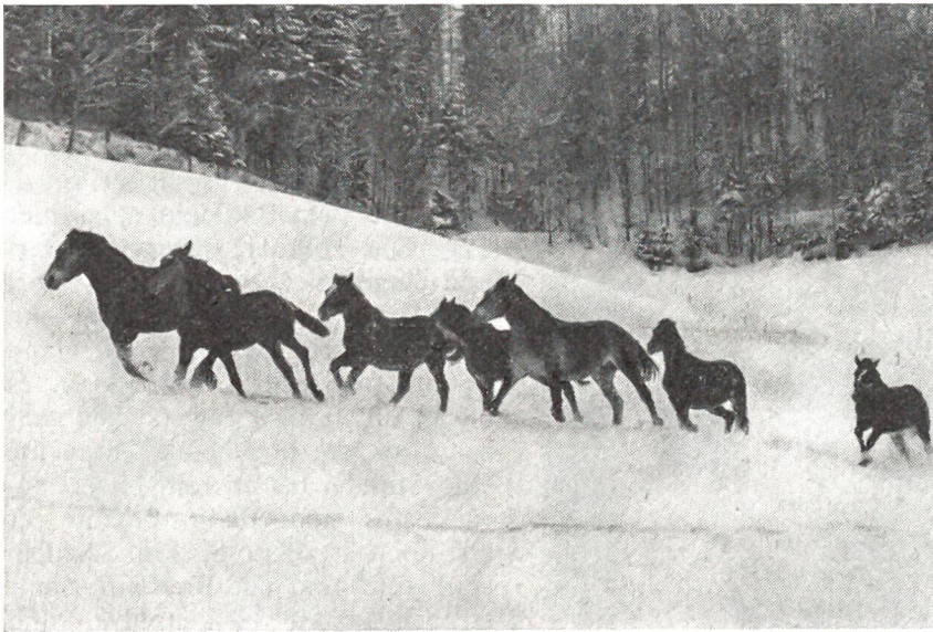
Pferde im Schnee

«Was ist deiner Meinung nach die eigentliche Ursache der augenblicklichen Unruhe unter den Indianern?» forschte der Reporter. Zunächst trat eine Pause ein, dann blies die «Grosse Schlange» eine gewaltige Rauchwolke in die Luft, nahm schliesslich die Pfeife aus dem Mund und brummte: «Flöhe!» (ici)