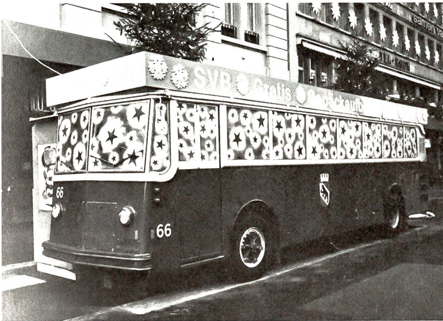
Gratis-Gepäckaufbewahrungs-Bus in Bern

«Himmelherrgott ...» Er verschluckte das übrige und starrte verbissen vor sich hin. Dann begann er sich mit dem Picknickkorb zu beschäftigen.