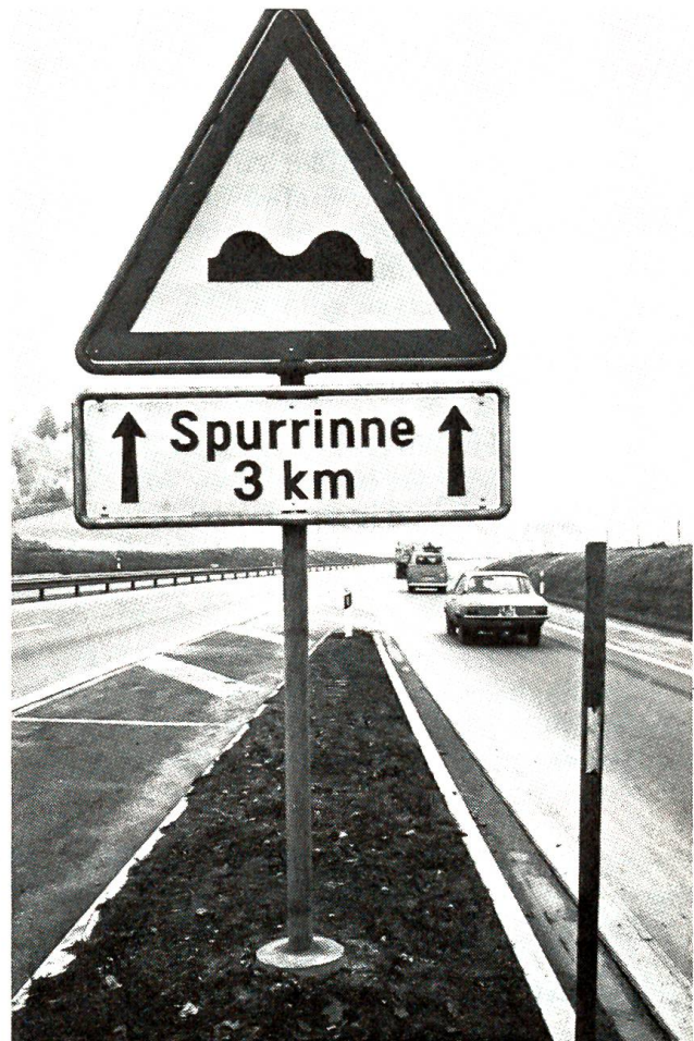
Miserabler Autobahnbau im Kanton Bern

«Ich weiss, ich weiss, Liebling, andere Frauen haben es viel leichter als du, und ich weiss auch,