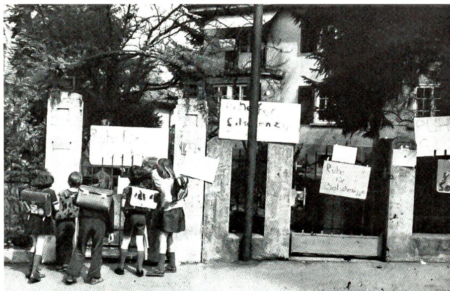
Alexander Solschenizyn in der Schweiz

Diese Überlegungen – sie hatten zur Folge, dass den Banken immer weniger Spargelder zufließen – und auch die Konjunkturdämpfungsmassnahmen des Bundes haben dazu geführt, dass im abgelaufenen Jahr die Zinssätze eine Höhe erreicht haben, wie das seit Jahrzehnten nicht mehr der Fall war. Am besten lässt sich das an den Obligationen der Schweizerischen Eidgenossenschaft verfolgen. Im Jahre 1965 konnte der Bund eine Anleihe zu 4¼% aufnehmen. 1966 war der Zinssatz auf 4½% gestiegen, und im März 1967 mussten 5% gewährt werden. Ein kurzer Rückgang der Zinssätze war von einem neuerlichen Aufstieg gefolgt; 1970 und 1971 5¼% und 5¾%, das sind die Stationen, die über eine nochmalige kurzfristige Senkung auf 4¾% im Jahre 1972 zu der letzten Bundesanleihe vom Mai 1974 führten. Sie war mit einem Zinssatz von 7½% ausgestattet und fand doch nur sehr schwer Abnehmer.