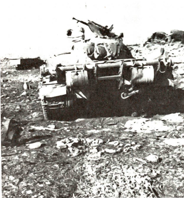
Der neue Nahostkrieg vom Oktober 1973 Ein Bild vom syrischen Kriegsschauplatz

hung, dass gegen ihn ein Gerichtsverfahren eingeleitet werden soll. Wie lange unter diesen Umständen Nixon noch ausharren wird, ist nicht auszumachen. Es scheint heute, dass er nicht nur sich selbst, sondern dem ganzen Volk einen Dienst erweisen könnte, wenn er von sich aus zurückträte. Am 10. Oktober trat auch noch der Vizepräsident, Spiro Agnew, zurück, oder besser, musste zurücktreten, weil er in seinem Heimatstaat wegen Steuerhinterziehung und undurchsichtiger Geschäfte verurteilt worden war. Das trug auch nicht gerade zu einer Festigung des Vertrauens in die Regierungstätigkeit Nixons bei. Nachfolger Agnews wurde Gerald Ford. Dass es unter den geschilderten Umständen schwerhält, im Innern und gegen aussen eine Politik der Stärke zu führen, liegt auf der Hand. Ausgerechnet in einer Zeit, in der es darauf ankäme, dass die Vereinigten Staaten einen starken Präsidenten hätten, werden fast alle Kräfte darauf verwendet, eine an sich zwar unerfreuliche und unsaubere, aber doch nicht weltbewegende