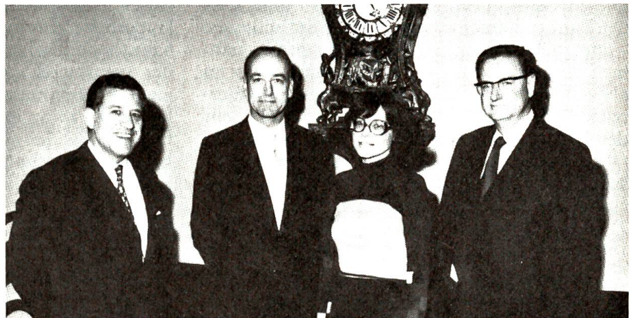
Bern hat eine Stadtschreiberin

Auch der Kanton Bern hat im abgelaufenen Berichtsjahr seine Regierung neu bestellt. Die Grossratswahlen vom 5. Mai 1974 brachten erstaunlich wenig Veränderungen. Am meisten Haare lassen musste die Sozialdemokratische Partei, die vier Sitze verlor, während die Nationale Aktion für Volk und Heimat deren fünf gewann. Auch der Landesring ist unter den Verlierern, indem von den bisherigen fünf Grossräten drei ihr Mandat verloren. Es scheint, dass der Landesring, die Nationale Aktion und die POCH (Progressive Organisationen der Schweiz) den sogenannten politischen Flugsand, die grosse Schar der Ewigunzufriedenen, um sich zu sammeln wissen. Das sind aber sehr unzuver-