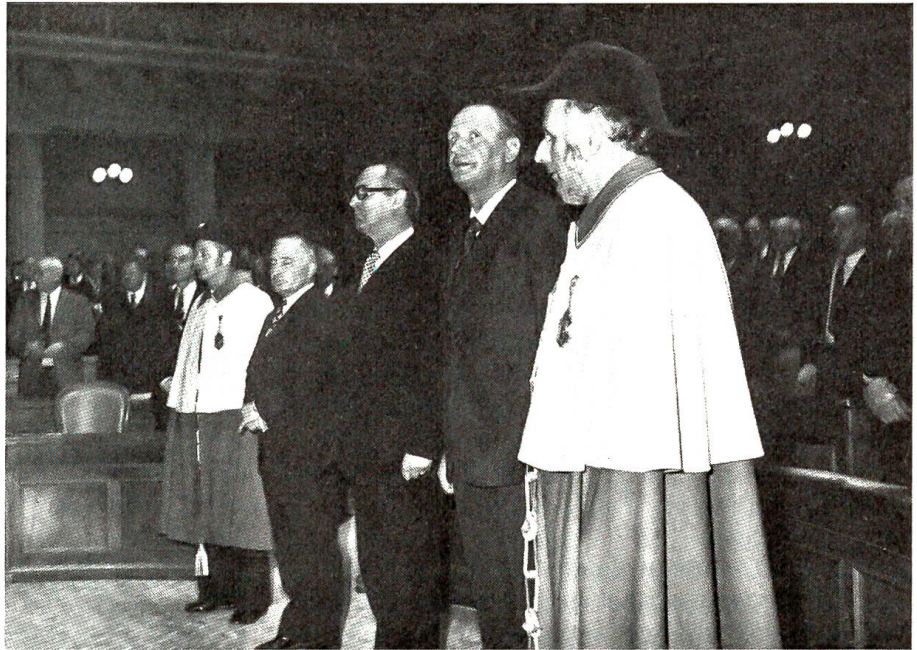
Drei neue Bundesräte werden vereidigt Von links nach rechts: Georges-André Chevallaz (Lausanne), Hans Hürlimann (Zug) und Willy Ritschard (Solothurn).

Daneben fanden wenig Urnengänge statt; in der Eidgenossenschaft ein einziger und im Kanton Bern deren zwei. Die eidgenössische Abstimmung vom 2. Dezember ging um die Bestätigung der Konjunkturdämpfungsmassnahmen, die ja bisher nur als Übergangsmassnahme vom Parlament gebilligt worden waren. Der Preisbeschluss, der Kreditbeschluss, der Baubeschluss und der Abschreibungsbeschluss wurden alleamt vom Volk mit erheblichen Stimmzahlen