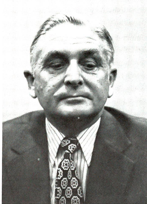
Ernst Brugger Bundespräsident für das Jahr 1974

Der Chronist hat letztes Jahr geschrieben, in den Vereinigten Staaten sei noch kein Ende der sogenannten Watergate-Affäre abzusehen, und es