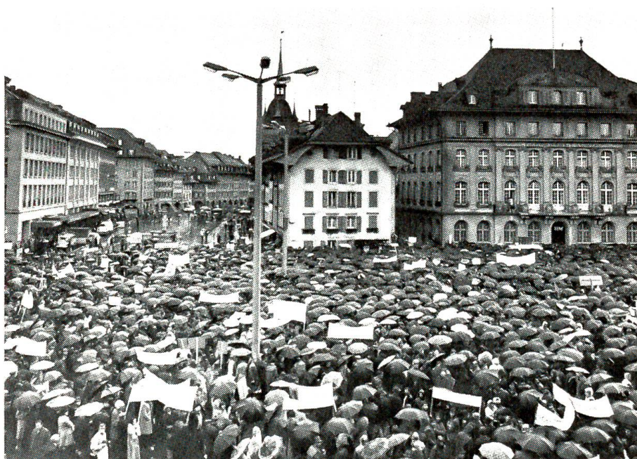
Grosse Bauerndemonstration vor dem Bundeshaus

Die dritte Überfremdungsinitiative steht vor der Tür. Die von der Nationalen Aktion für Volk und Heimat eingereichte Initiative hat zum Gegenstand, den Bestand der ausländischen Wohnbevölkerung bis Ende 1977 auf 500 000 Personen herabzusetzen. In keinem Kanton dürfte der Ausländeranteil 12% der schweizerischen Staatsangehörigen übersteigen. Der Bundesrat lehnte die Initiative entschieden ab; würde sie ange-