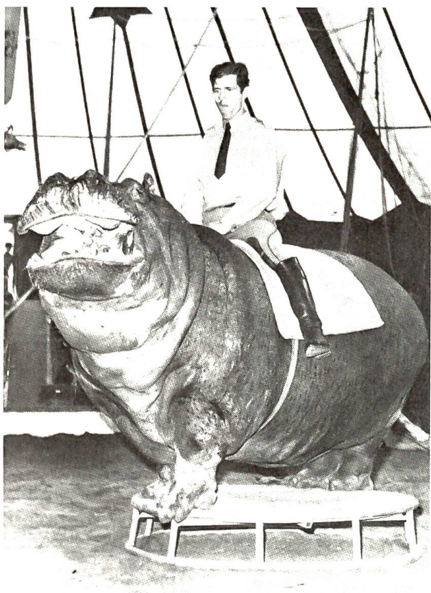
Vom Pferderücken auf den Nilpferdrücken

Anlässlich eines Gastspiels des Zirkus Knie in Bern konnte dieser Bereiter einen instruktiven Vergleich anstellen: statt