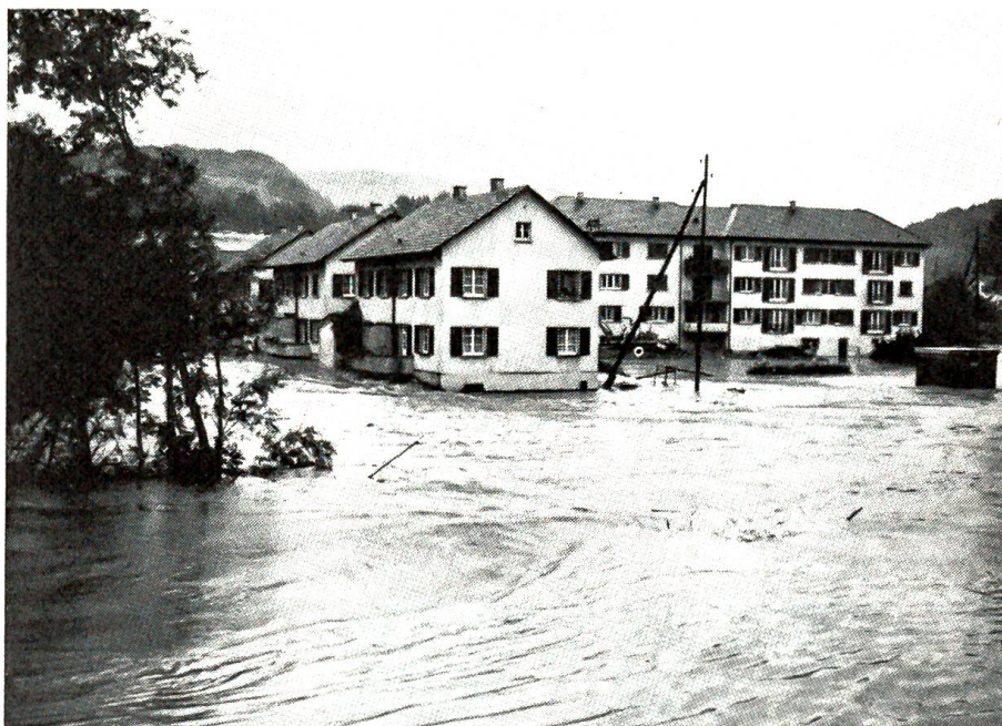
Schwere Überschwemmungen im Birstal

Ein unbändiger Trotz überkam ihn. Hätten die beiden das Geldstück nicht auch behalten können wie er, statt es ihm wieder aufzudrängen? Musste er fast einen Franken bezahlen, bloss weil die beiden eine so fanatische Ehrlichkeit entwickelten? Wo stand er jetzt? Das Fünffrankenstück musste er los sein, er ertrug die Spannung nicht mehr. Aber wo bot sich eine