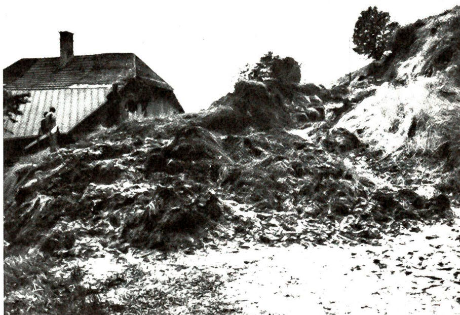
Erdrutsche schliessen Eriz von der Umwelt ab

Einige Schritte nur. Dann hörte er eine rufende Stimme hinter sich: «Sie, Herr!» – Ein junger Mann kam eilig auf ihn zugeschritten: «Sie haben soeben das da verloren. Ich sah, wie