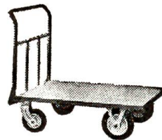
Magazinwagen mit Lenkrollen