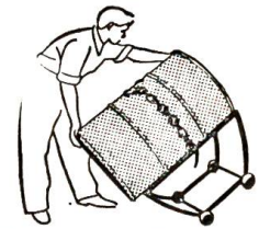
Der Fassbock mit seinen interessanten Abwälzkufen