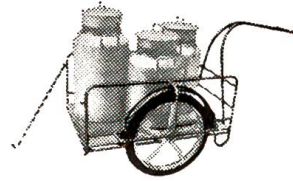
Primus-Veloanhänger in grosser Auswahl

Die bekanntesten und beliebtesten Primus-Fahrzeuge